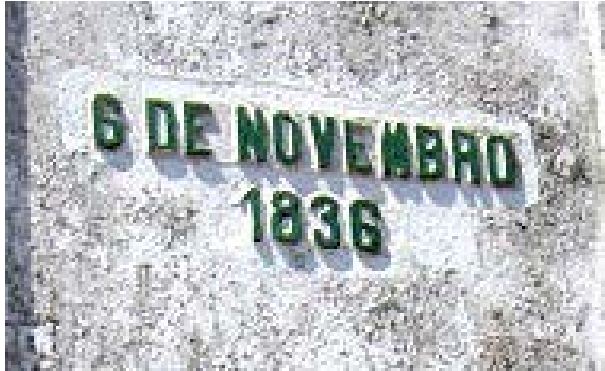
Imagem 7 – Data na face da direita do Obelisco Domingos José de Almeida, “6 de novembro – 1836”

Fonte: GIORDANI, Laura. O Obelisco de Pelotas e Sua Análise Iconográfica. Cadernos de Clio, Curitiba, v. 6, n. 2, p. 110, 2015.