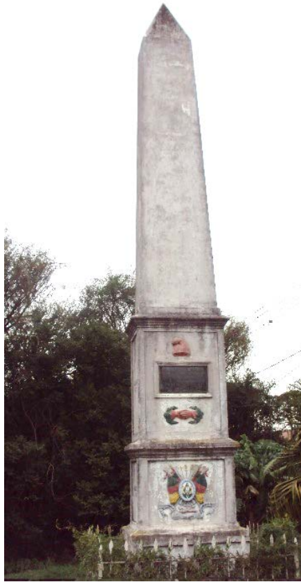
Imagem 1 – Obelisco Domingos José de Almeida, Pelotas, Rio Grande do Sul

Fonte: GIORDANI, Laura. O Obelisco de Pelotas e sua Análise Iconográfica. Cadernos de Clio, Curitiba, v. 6, n. 2, p. 103, 2015.