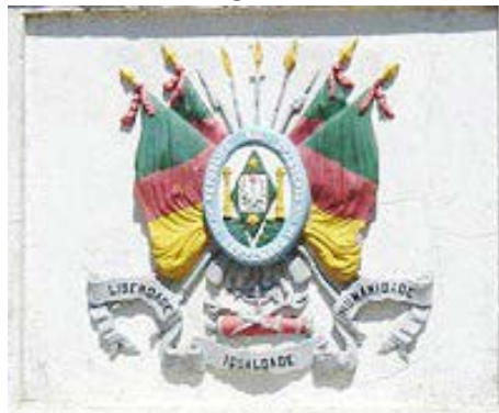
Imagem 5 - Brasão de Armas Rio-Grandense, face frontal do Obelisco Domingos José de Almeida

Fonte: GIORDANI, Laura. O Obelisco de Pelotas e Sua Análise Iconográfica. Cadernos de Clio, Curitiba, v. 6, n. 2, p. 108, 2015.