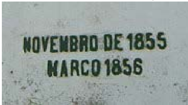
Imagem 11 – Datas na face posterior do Obelisco Domingos José de Almeida, “Novembro de 1855” e “Março de 1856”