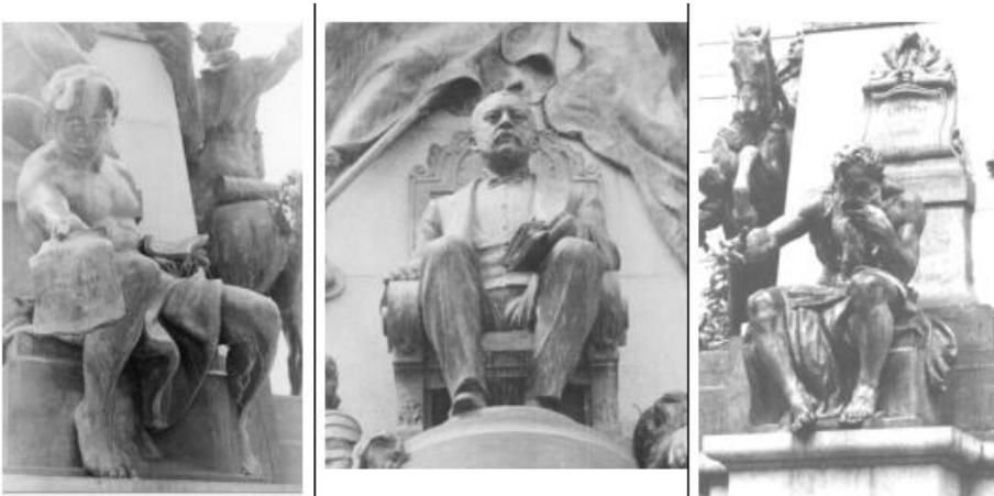
Imagem 13 – Representações das fases de vida de Castilhos, Monumento a Júlio de Castilhos: Juventude, à esquerda; Maturidade, no centro; Velhice, à direita.