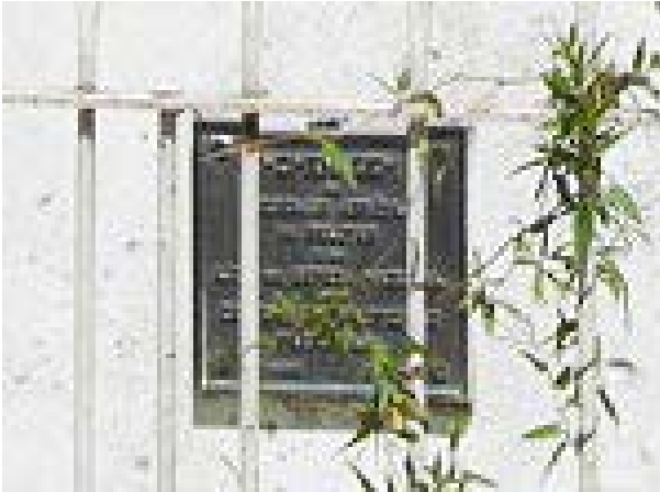
Imagem 6 - Segunda placa de bronze, face frontal do Obelisco Domingos José de Almeida