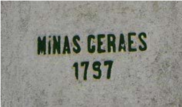
Imagem 10 – Data na face da esquerda do Obelisco Domingos José de Almeida, “Minas Geraes – 1797”