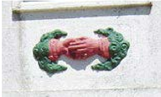
Imagem 4 – Aperto de mãos, face frontal do Obelisco Domingos José de Almeida