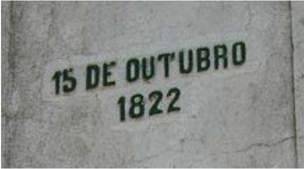
Imagem 9 – Data na face da esquerda do Obelisco Domingos José de Almeida, “15 de outubro – 1822”

Fonte: GIORDANI, Laura. O Obelisco de Pelotas e Sua Análise Iconográfica. Cadernos de Clío, Curitiba, v. 6, n. 2, p. 112, 2015.