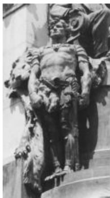
Imagem 14 – Personificação dos aspectos da Personalidade de Castilhos no Monumento à Júlio de Castilhos: Firmeza, à esquerda; Prudência, no centro; Coragem, à direita.