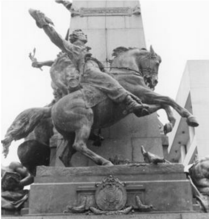
Imagem 15 – Imagem do Gaúcho na face posterior do Monumento a Júlio de Castilhos.