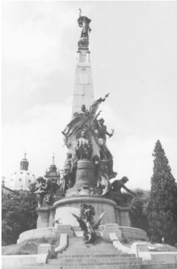
Imagem 12 – Visão geral do Monumento a Júlio de Castilhos