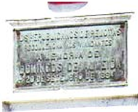
Imagem 3 - Placa de bronze, face frontal do Obelisco Domingos José de Almeida