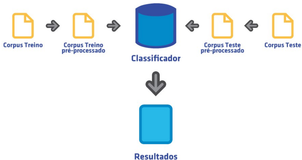
Figura 1 – Fluxo para treinamento e teste do classificador

Foram utilizados dois tipos de corpus diferentes para realizar o treinamento do classificador, ilustrados na figura 1. O primeiro corpus é para o treinamento dos classificadores, esse corpus será pré-processado antes de alimentar o classificador com amostras e o resultado esperado para cada uma. O segundo corpus é o corpus para testes. Esse corpus passará pelo mesmo pré-processamento que o corpus de treino, porém seu objetivo é testar o classificador para que seja possível realizar comparativos entre mudanças no pré-processamento, algoritmo e parâmetros do classificador.