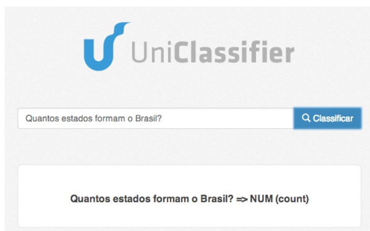
Figura 3 – Exemplo de uso da interface Web implementada

Esta interface está disponibilizada para uso e testes a partir da seguinte url: http://henriquebraum.pythonanywhere.com/ , sendo considerada neste momento como um elemento experimental do trabalho.