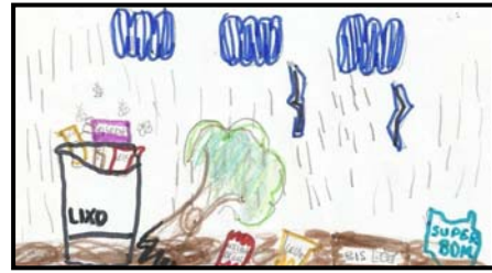
Figura 6 - Representação de uma cidade com a falta de saneamento básico

A questão 3 do pré-teste e a 4 do pós-teste focalizavam as consequências da falta de saneamento básico. Importante destacar que, de acordo com o Sistema Nacional de Informações sobre Saneamento (SNIS) 2010, apenas 53,5% da população urbana brasileira tem acesso à coleta e 37,9% ao tratamento de esgotos, ocasionando, desta forma, a contaminação de rios, mananciais, praias e solo. Consequentemente, a saúde da população fica prejudicada, em decorrência das doenças geradas pela falta de tratamento de água e esgoto (TRATA BRASIL, 2012).