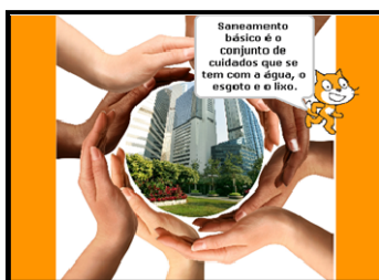
Figura 1 - Tela de apresentação inicial da história

A Figura 1 ilustra um trecho inicial da história que conceitua saneamento básico.