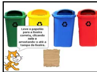
Figura 3 - Tela de apresentação com orientações do jogo Coleta Seletiva

O estudante recebe uma mensagem inicial orientando-o a levar o lixo até a lixeira correta, de acordo com o material, conforme ilustra a Figura 3.