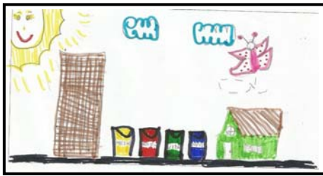
Figura 5 - Representação de uma cidade limpa