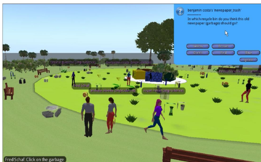
Figura 2. Fase do Jogo I-AI3

Para Bairon (2004), há atualmente na Internet muitas oportunidades para o desenvolvimento de metodologias hipermidiáticas, que permitem ir além da divisão de tarefas, que explorem apenas a leitura e a escrita, ou apenas a arte (imagem e som). Temos que considerar a multiplicidade de multimodalidades que se projetam em diferentes ambientes virtuais e que podem se tornar significativas para a aprendizagem de uma língua estrangeira. De acordo com Fonseca (2005, p. 127), “podemos supor que as potências de imagens digitalizadas instauram um novo regime semiótico em que o referente é anulado remetendo às imagens a si próprias”.