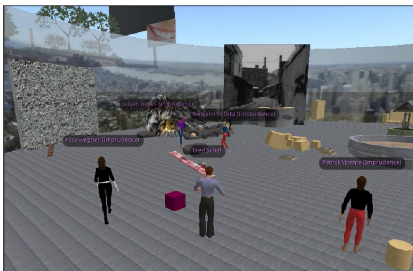
Figura 3. Fase do Jogo I-AI3

Para Bairon (2004), há atualmente na Internet muitas oportunidades para o desenvolvimento de metodologias hipermidiáticas, que permitem ir além da divisão de tarefas, que explorem apenas a leitura e a escrita, ou apenas a arte (imagem e som). Temos que considerar a multiplicidade de multimodalidades que se projetam em diferentes ambientes virtuais e que podem se tornar significativas para a aprendizagem de uma língua estrangeira. De acordo com Fonseca (2005, p. 127), “podemos supor que as potências de imagens digitalizadas instauram um novo regime semiótico em que o referente é anulado remetendo às imagens a si próprias”.