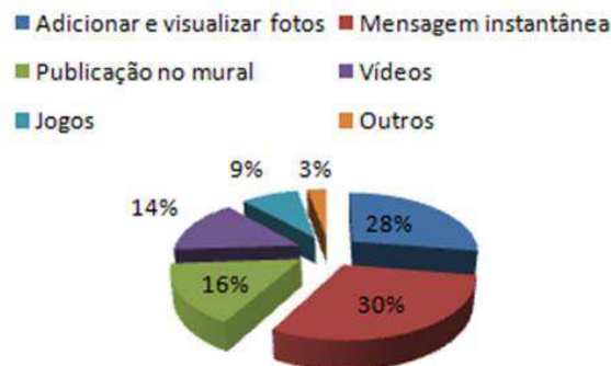
Figura 3: Percentual das ferramentas utilizadas nas redes sociais

A comunicação é primordial para idosos, uma vez que permite a socialização e participação, principalmente com familiares que em muitos casos se distanciam dos seus pais/avós. As tecnologias de informação e comunicação (TIC) possibilitaram esta comunicação mais rápida com os amigos e familiares. Com fenômeno das redes sociais, a comunicação se intensificou e aproximou mais as pessoas.