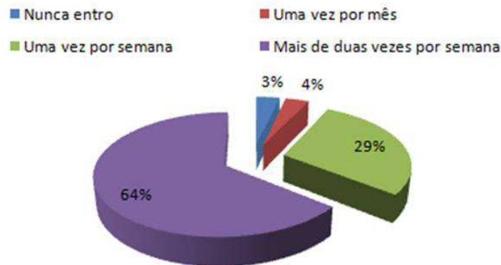
Figura 2: Percentual do uso das redes sociais

Em relação às ferramentas disponíveis nas redes sociais, predominou o uso de mensagens instantâneas (30%), seguido de fotos (28%) e publicações no mural (16%) (Figura 3). Isso mostra que a comunicação ainda é o foco dos idosos.