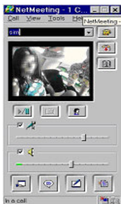
Figura 3: Paciente 1 visualizada pela Paciente 2 através do NetMeeting

A atividade foi encerrada, quando a Paciente 2 percebeu, através da câmera que a Paciente 1 estava cansada e o jantar já estava chegando ao quarto. (Fig. 3).