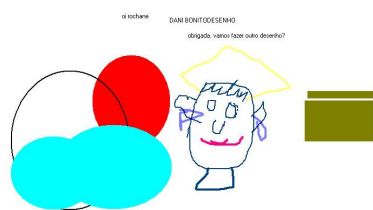
Figura 1: Desenho compartilhado (“bolas”)

A Paciente 2 perguntou se era possível também escrever no quadro do desenho. Diante da possibilidade confirmada por uma das coordenadoras, imediatamente registrou que o desenho estava bonito. Em resposta, a Paciente 1 escreveu: “Obrigada. Vamos fazer outro desenho?” A Paciente 2 solicitou que a Paciente 1 desenhasse para ela. Prontamente esta atendeu ao pedido, desenhando várias “bolas coloridas” (conforme a Paciente 2 denominou), sempre observando as reações da Paciente 1 através da câmera instalada em sua máquina. Ao final, a Paciente 2 contou as figuras e registrou no quadro : “26 bolas”.