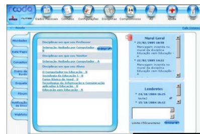
Figura 2 - Interface com