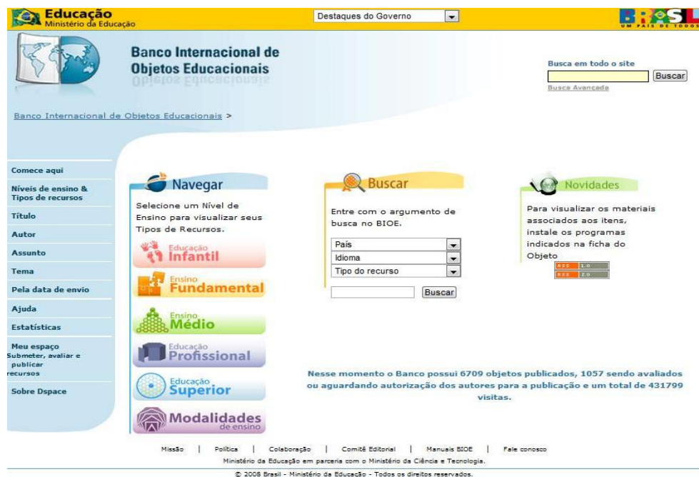
Figura 1: Tela Inicial do Banco Internacional de Objetos Educacionais (BIOE) 4

Os recursos pedagógicos digitais, OE, disponíveis neste repositório objetivam atender a Educação Básica, profissionalizante e o ensino superior, nas mais diversas áreas do conhecimento, conforme ilustra a Figura 1.