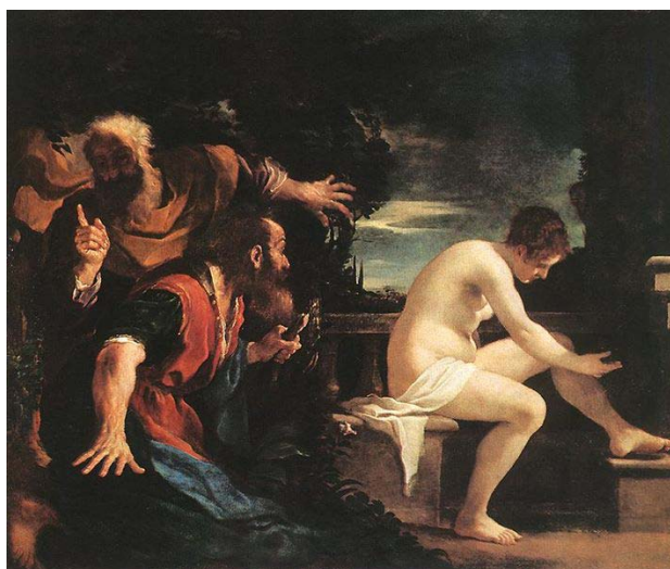
Figura 7 - Susana e os velhos , de Guercino, 1617

Os velhos escondidos espreitavam, esperando ansiosamente a hora do passeio de Susana. Todos os dias espiavam a bela mulher nos seus momentos de recolhimento. Por fim, os dois se puseram de acordo para surpreender a esposa de Joaquim e violentá-la (Figura 7).