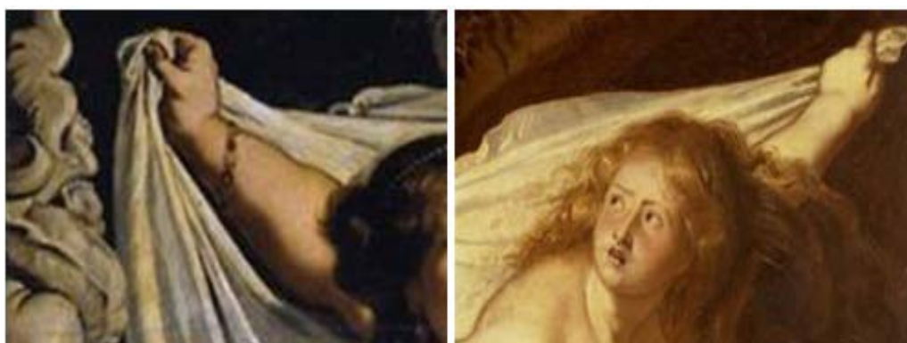
Figura 18 - Detalhe das pinturas de Rubens, 1609-10, e 1611

Fonte: Adaptado de Rubens (1609) e (1611).