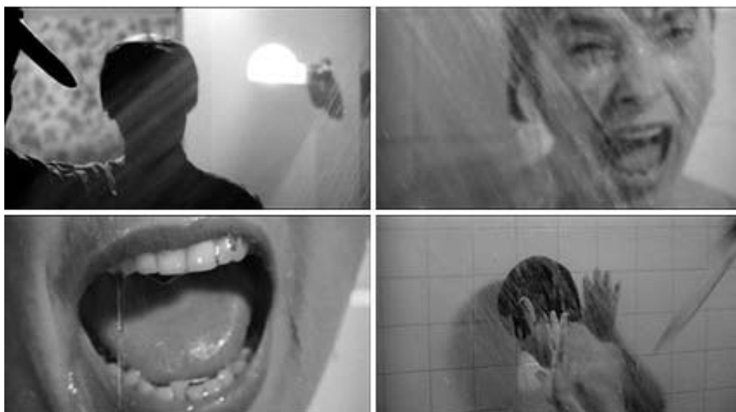
Figura 15 - Cenas Psicose