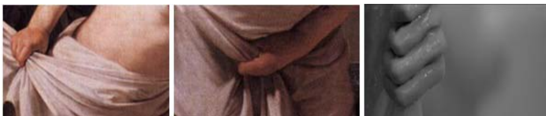
Figura 17 - Detalhes da pintura Gerrit van Honthorst, e mão de Marion agarrando-se na cortina do banheiro