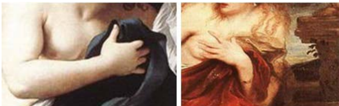
Figura 20 - Detalhe de Sisto Badalocchio, 1609, e Sir Anthony van Dyck, 1621-22

Fonte: Adaptado de Badalocchio (1609) e Dyck (1621).