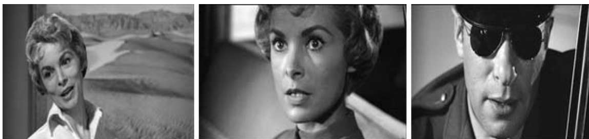
Figura 28 - Cenas da Fuga de Marion em Psicose (1960a)