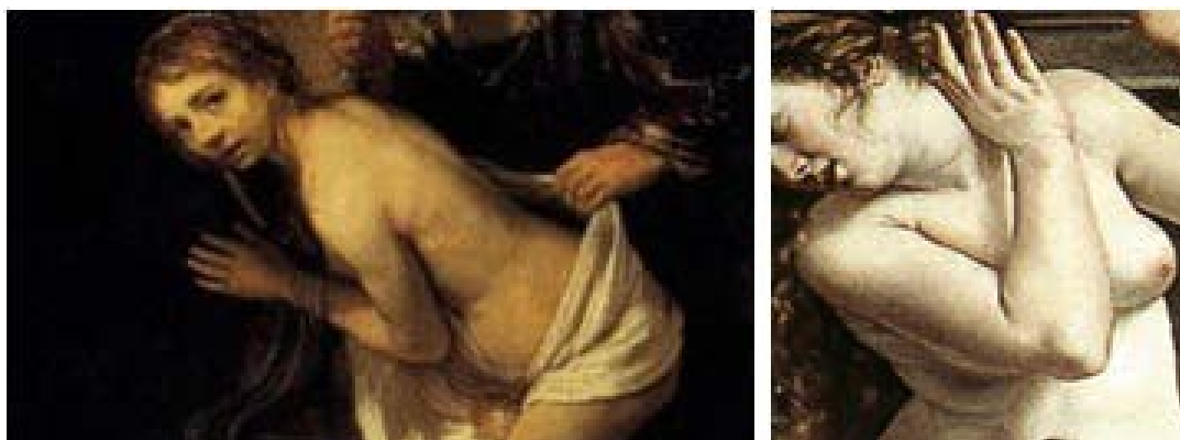
Figura 21 - Detalhe da pintura de Rembrandt, 1647 e Artemisia Gentileschi, 1610

Fonte: Adaptado de Rembrandt (1647) e Gentileschi (1610).