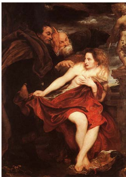
Figura 12 - Susana e os velhos , de Sir Anthony van Dyck, 1621-22,