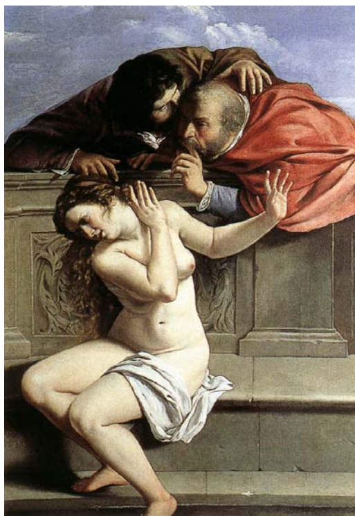
Figura 14 - Susana e os velhos - Artemisia Gentileschi, 1610.

No tema representado pela pintora Artemisia Gentileschi (Figura 14), as mãos dos três personagens presentes na cena encontram-se na forma de um expressivo diálogo de assédio e defesa.