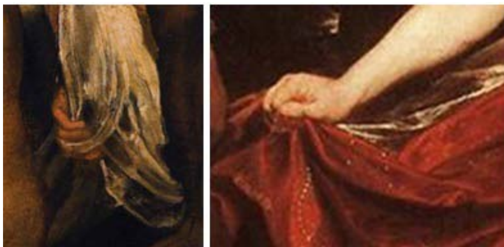
Figura 19 - Detalhe pintura de Rubens, 1607-08, e Sir Anthony van Dyck, 1621-22

Fonte: Adaptado de Rubens (1607) e Dyck (1621).