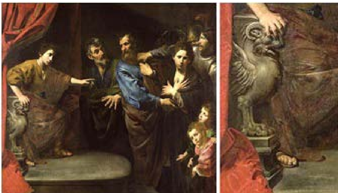
Figura 30 - Daniel proclama a inocência de Susana , Valentin de Boulogne (1625), e detalhe da mesma pintura

Neste sentido, é significativo o quadro Daniel proclama a inocência de Susana (1625), de Valentin de Boulogne, pertencente ao Museu do Louvre , em Paris. Na pesquisa sobre o tema de Susana e os velhos , esse quadro, cuja cena é protagonizada pelo profeta Daniel, ressaltou-se como uma possível resposta ao enigma inicialmente proposto. Na pintura, observa-se um detalhe significativo: a poltrona sobre a qual Daniel está sentado tem como braço um entalhe com a figura de uma esfinge (animal mitológico que propõe o enigma sobre a condição humana). O gesto da mão direita do profeta, tapando os olhos da esfinge, (Figura 30) ressalta que o crime cometido contra Susana foi no âmbito de um olhar portador do gozo mortífero, do voyeurismo, e, por isto, deve ser contido, impedido e limitado. O ser humano é um ser de limites e esta é a máxima de sua condição, sem a qual se corre o risco do retorno à barbárie.