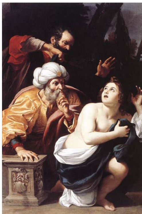
Figura 9 - Susana e os velhos , de Sisto Badalocchio, 1609

Susana, etimologicamente, é quem possui a graça do lírio branco, alva e pura 4 . Ela representa, nesse relato, não a pureza das virgens, mas a honra das esposas fiéis. É portadora da fidelidade daquelas que cumprem com a palavra dada. Sua beleza incorrupta atrai o olhar dos homens sombrios, dos corruptos, dos falsos representantes da lei (Figura 9).