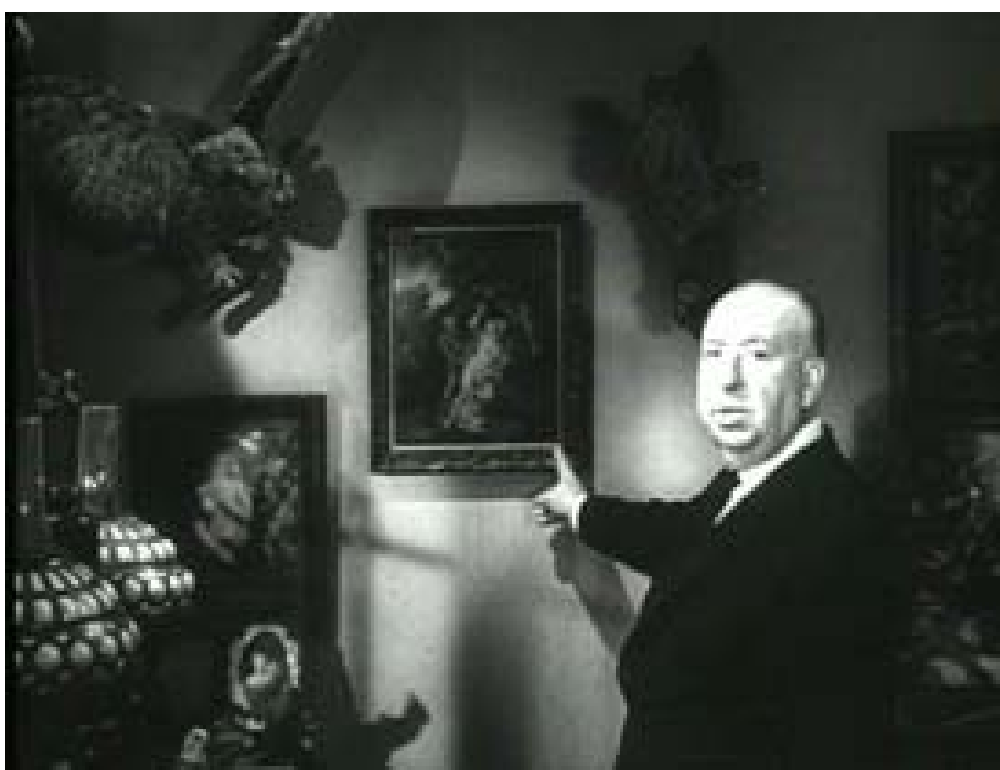
Figura 4 - Hitchcock aponta para o quadro no trailer de Psicose