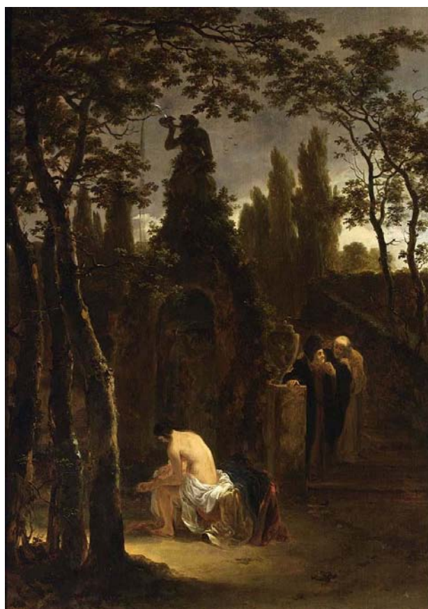
Figura 6 - Susana e os velhos , de Jan Both, 1642

O relato de Susana e os velhos é um dos textos mais fascinantes do Livro de Daniel, presente na Bíblia. Conta a história de uma mulher muito bela, esposa de Joaquim, um influente judeu exilado na Babilônia. Dois velhos que haviam sido nomeados juízes entre os judeus iam diariamente à mansão de Joaquim para aconselhar aos que necessitassem. A beleza de Susana atraiu a atenção dos homens da lei, que começaram a observá-la em segredo quando a mulher saía para dar um passeio diário pelo seu jardim. Pouco a pouco vai crescendo a cobiça e a lascívia no ânimo dos juízes (Figura 6).