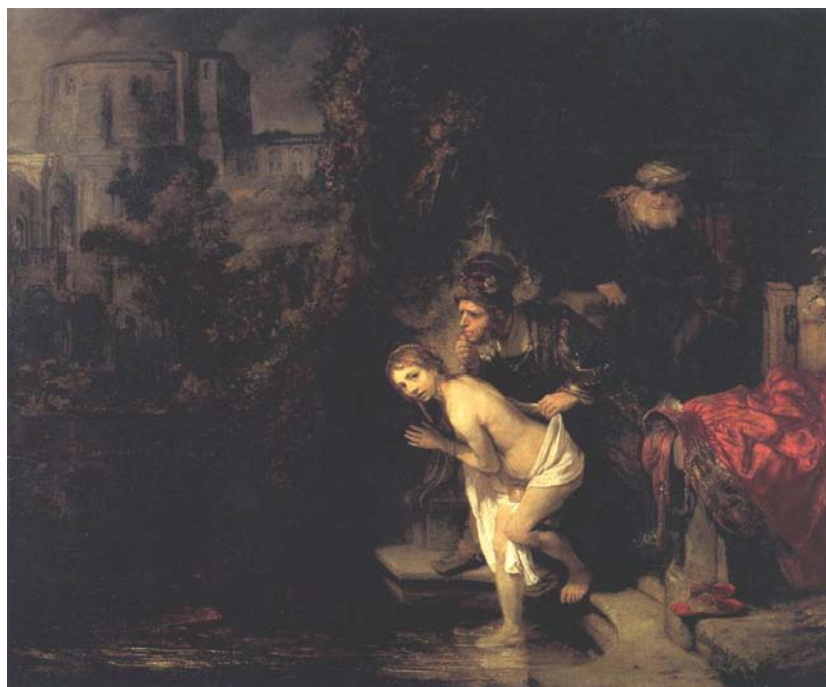
Figura 10 - Susana e os velhos , de Rembrandt, 1647