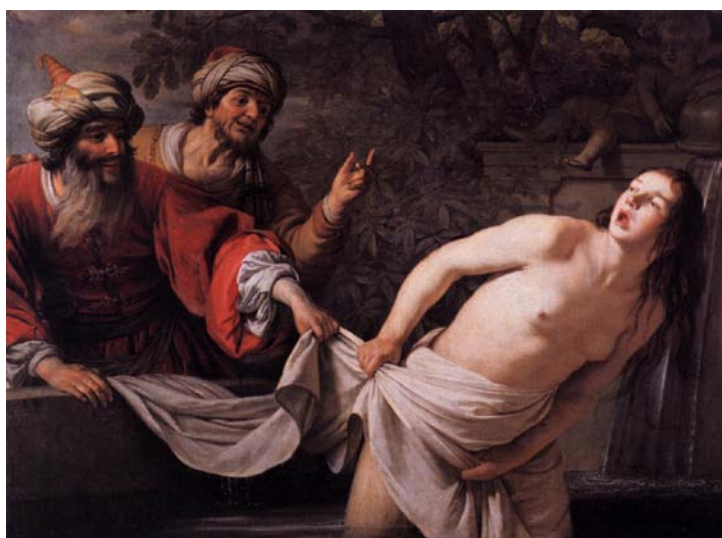
Figura 8 - Susana e os velhos , de Gerrit van Honthorst, ca. 1600

Em um dia de calor, Susana passeava pelo seu pomar e pediu às criadas que fechassem os portões do palácio porque iria banhar-se na fonte. De repente, os velhos juízes a surpreendem, agarram a mulher e tentam violá-la. Susana os repudia e chorando aos gritos, solicita a intervenção divina (Figura 8).