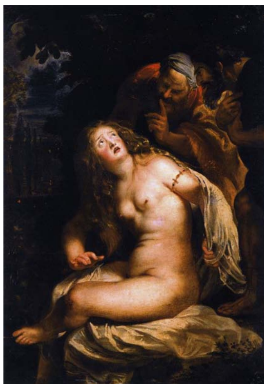
Figura 11 - Susana e os velhos , de Peter Paul Rubens, 1607-08.

invadido e envolvido pelo invisível, e o finito, por um torvelinho de infinitude. “Por isto esta arte pode captar ou ‘surpreender’ instantâneas fugazes, cenas ‘realistas’, atos colhidos de surpresa, cenários extraídos do curso mesmo da vida.” (TRÍAS, 2006, p. 80, tradução nossa). Atrevemo-nos a dizer que os quadros escolhidos são quase fotogramas, instantâneas fílmicas, convocando-nos a estabelecer um diálogo entre o cinema e a pintura (Figura 11).