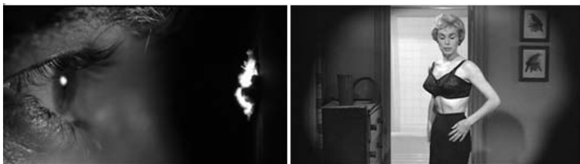
Figura 5 - Norman observando pelo buraco na parede e Marion despindo-se e sendo observada por ele