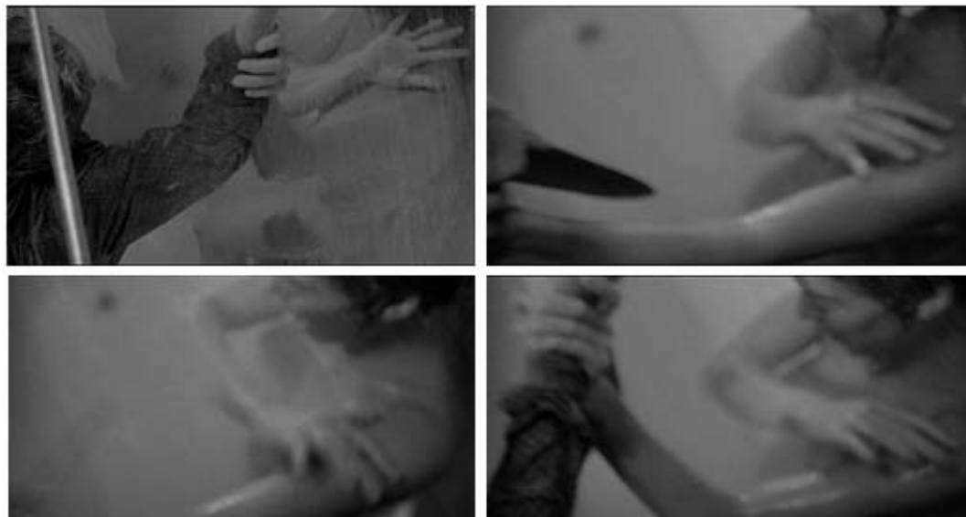
Figura 22 - Cenas do ataque de Marion em Psicose (1960a)