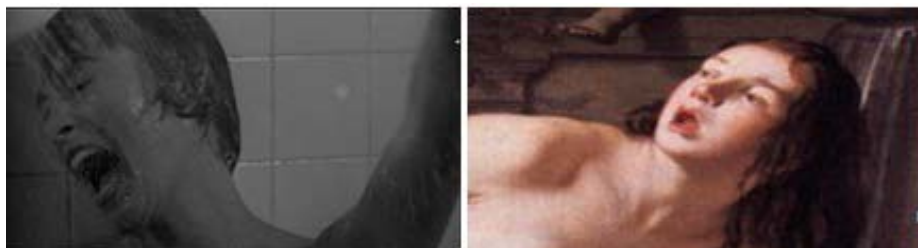
Figura 16 - Marion grita e defende-se da assassina, e detalhe da pintura de Gerrit van Honthorst