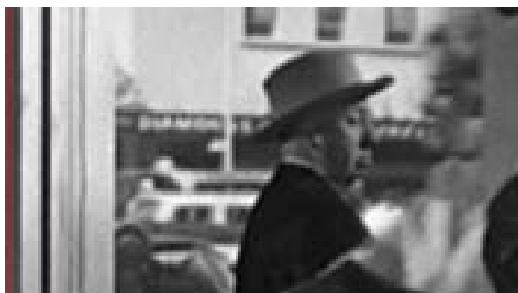
Figura 25 - Hitchcock observando Marion