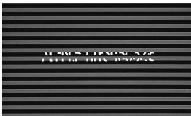
Figura 24 - Linhas horizontais atravessam o nome de A. Hitchcock