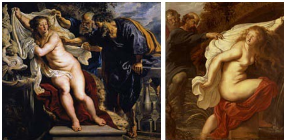
Figura 13 - Susana e os velhos , de Peter Paul Rubens, 1609-10 e Susana e os velhos , de Rubens, 1611.

A mulher tenta preservar-se e debate-se, protegendo-se com os tecidos que lhe restam, gesticula com suas mãos e mostra seu repúdio com a inclinação de seu corpo. Susana representa este ponto que é fronteira para o olhar, o lugar da mulher como sagrado e inviolável.