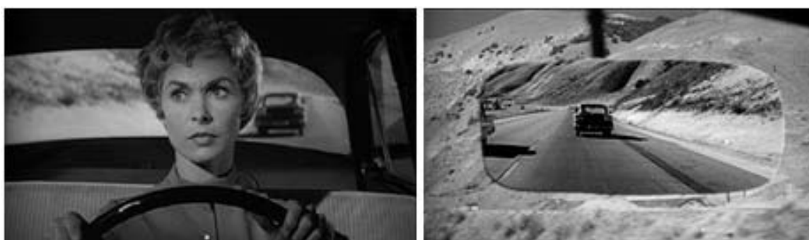
Figura 29 - Fuga de Marion em Psicose (1960a)