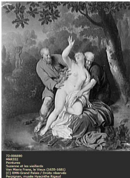
Figura 2 - Susana e os velhos , de Van Mieris Frans, o velho

Fonte: Adaptado de Mieris (16--?). Registro do Musée Hyacinthe Rigaud , Perpignan, de 1957.