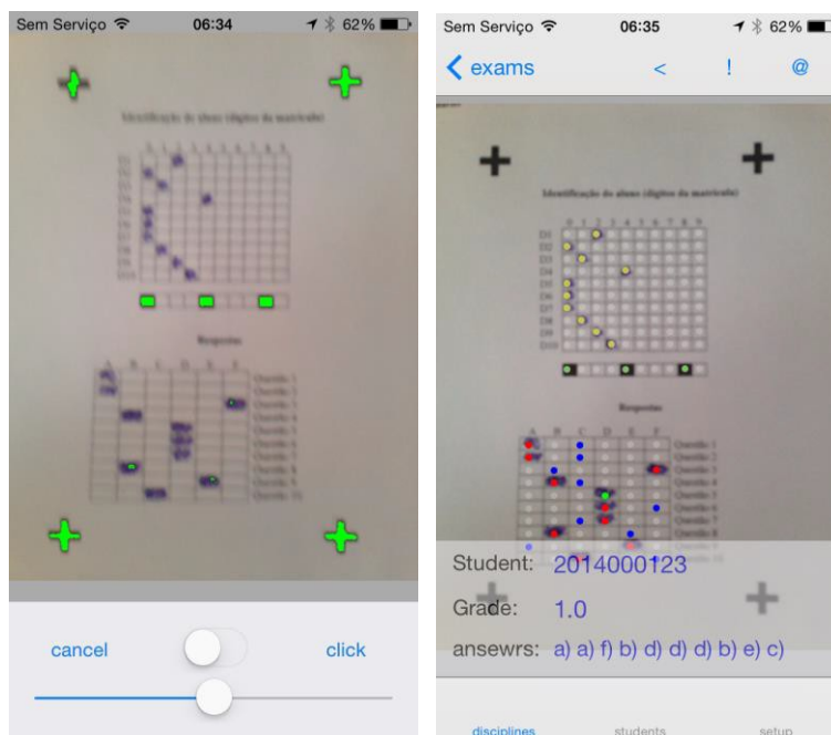
Figura 3. Telas do aplicativo referentes ao sistema de correção automática.

organização do estudo dos alunos; diluição do peso da avaliação somativa ao final da unidade; maior convergência entre as ações do professor e as necessidades dos alunos. Pesquisas qualitativas indicam que, para a grande maioria dos alunos, a ferramenta funciona como um recurso auxiliar importante para o bom andamento dos estudos, contribuindo para reduzir os índices de reprovação. Para os professores, os testes representam um instrumento eficiente para disciplinar o estudo dos alunos e verificar rapidamente o sucesso de estratégias didáticas, sem comprometer suas demais atividades acadêmicas.