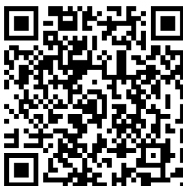
Figura 3. QR-Code for access at RExLab portal.

Outro interessante recurso que pode facilitar o compartilhamento e o acesso a estes conteúdos online é o QR-code, um código de barras em 2D que, quando escaneado, é convertido para um link.