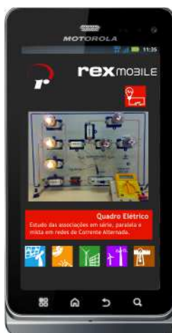
Figura 1. Screenshot do aplicativo RexMobile

Com estes conceitos o Laboratório de Experimentação Remota da Universidade Federal de Santa Catarina tem desenvolvido o REx-Mobile, um aplicativo adaptado para uso de experimentos remotos por diferentes Sistemas Operacionais.