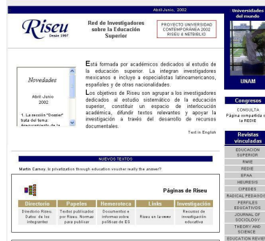
Figura 2- Red de Investigadores sobre la Educación Superior

A RIFAD 6 (Rede Iberoamericana de Formação e Atualização Docente, da Espanha) surge como resposta à criação de canais estáveis de comunicação entre os profissionais preocupados com a formação e atualização dos docentes iberoamericanos.