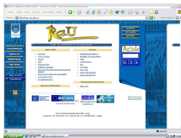
Figura 1- Rede Acadêmica do Uruguai

Como pode ser verificado, a RAU é uma rede mais aberta, ampla. A partir dos subgrupos que as temáticas e objetivos específicos são delineados, conforme Figura 1.