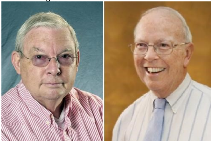
Figura 1 - Donald L. Shaw e Maxwell McCombs