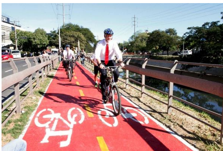
Figura 1: Foto oficial da inauguração da ciclovia de Porto Alegre em 07 de maio de 2012.

inauguração 10 , a inauguração em si 11 , e os protestos feitos pela população na própria ciclovia horas após a inauguração 12 . Porém, também é possível identificar notícias que atestam a recirculação do acontecimento e sua repercussão nas redes, como em duas matérias encontradas no Terra: a galeria de fotos “Ano eleitoral apressa inaugurações; veja obras inacabadas” de 15 de maio de 2012, que inclui a ciclovia da Avenida Ipiranga em Porto Alegre, RS 13 , e a notícia “Porto Alegre: prefeito anda na contramão em ciclovia e vira piada”, de 08 de maio de 2012 14 , que transforma em notícia um dos desdobramentos conferidos pelo público nas redes sociais. A imagem que chamou a atenção e virou piada nas redes sociais mostra o prefeito José Fortunati trafegando de bicicleta na contramão no trecho inaugurado da ciclovia (Figura 1). A fotografia foi distribuída pela Assessoria de Imprensa da Prefeitura de Porto Alegre 15 e foi exibida em diversos jornais 16 .