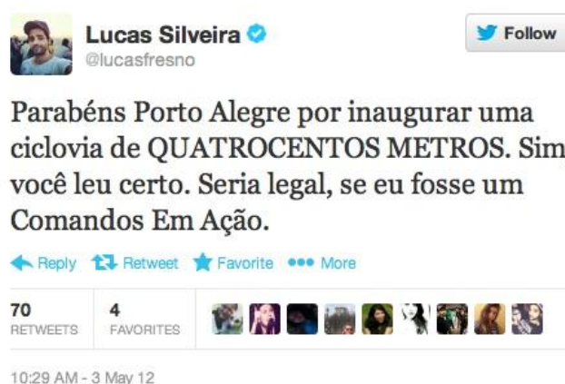
Figura 3: Tweet de Lucas Fresno sobre a ciclovia da Avenida Ipiranga.