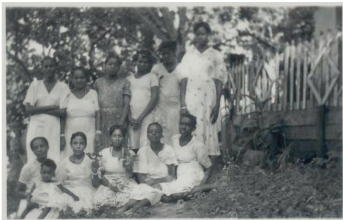
Figura 2 - Filhas de Xangô em frente ao Engenho Velho, 1938.