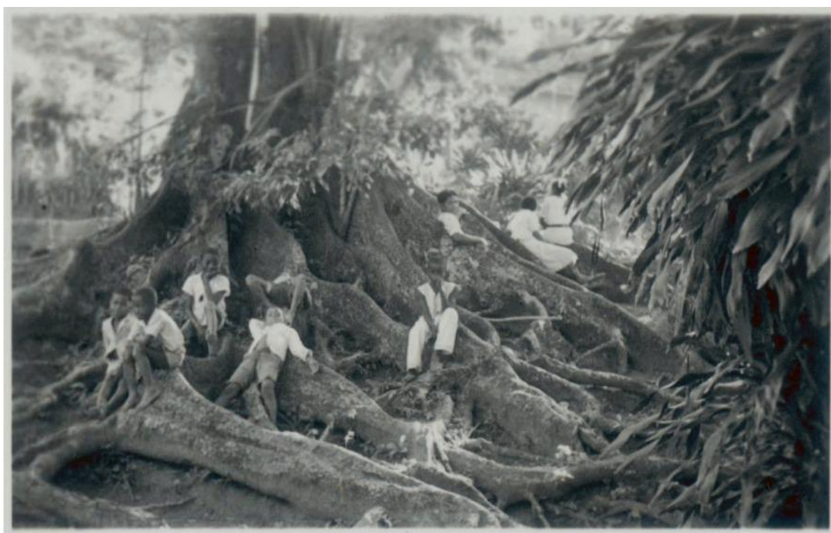
Figura 4 - Crianças descansando nas raízes gigantes de árvores no Engenho Velho, 1938.