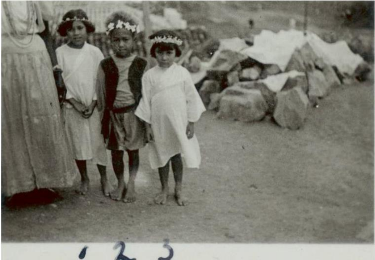
Figura 5 - Três netos de Sabina numa cerimônia para Iemanjá, 1938.