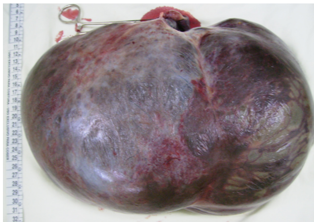
Figura 2: Cisto Mucinoso ressecado.