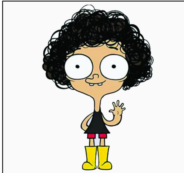
Figura 3 — Personagem “Irmão do Jorel”

Fonte: criado por Juliano Enrico (2014).