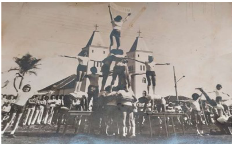
Figura 3 – Apresentação do dia 7 de setembro na sede do município (1978)