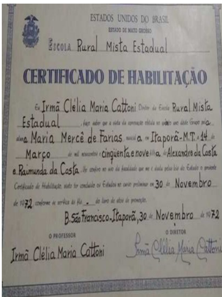
Figura 7 – Certificado de Habilitação (1972)