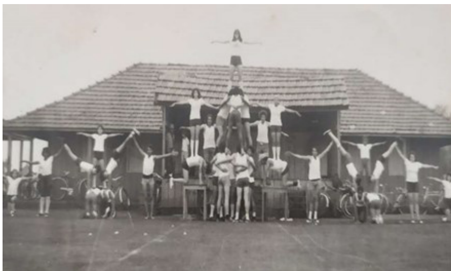
Figura 2 – Pirâmide Humana (1977)