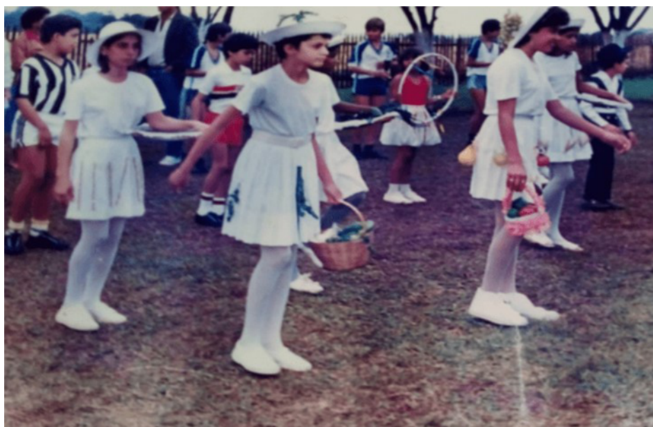
Figura 6 – Desfile de 7 de setembro [197?]