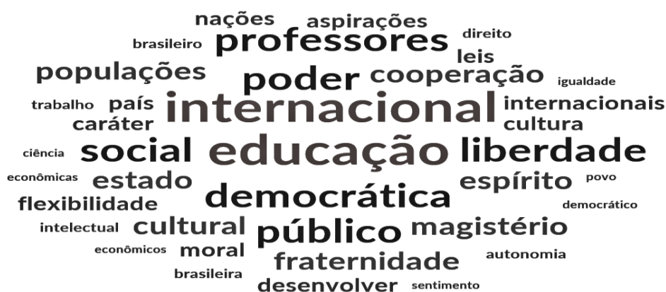
Figura 3 - Vocábulo presentes no jogo de linguagem praticado nos debates do IX CBE