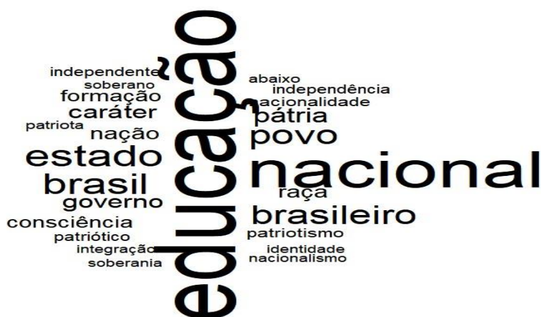
Figura 2 – Vocabulário presente nos debates da ICNE (1927) relativo ao conceito de independência e os seus correlatos semânticos.