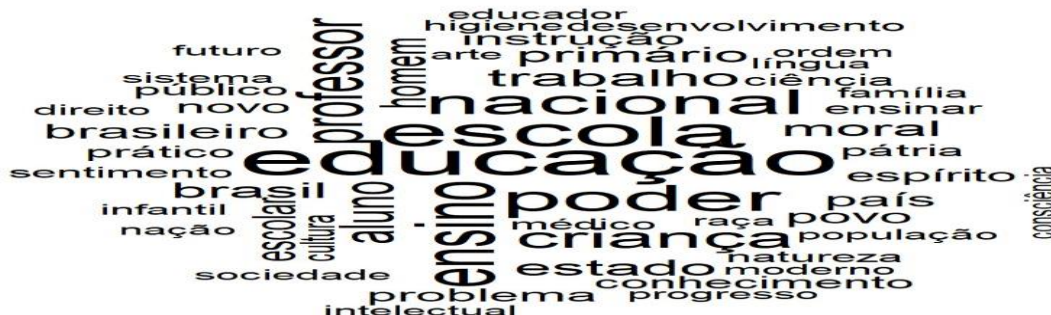
Figura 1 – Vocábulo utilizados nos debates da ICNE (1927) com, no mínimo, 100 ocorrências.