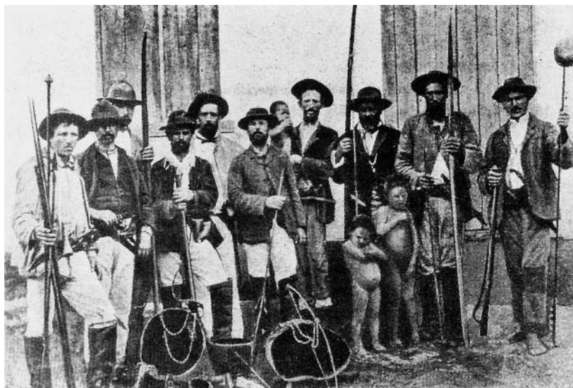
Figura 1 – Ritorno di una battuta. Trofei e prigionieri (1883).

A civilização impunha-se à barbárie, chegando com botas longas e chapéu, em expressão de poder e força, além de em uma posição distinta na sociedade. Porém, cabe o questionamento de qual representação de civilidade estava implícito nessas incursões de imigrantes pela floresta na busca da ocupação, ou ainda, que imagem se cristalizava – no imaginário dos recém chegados – dessas populações autóctones, qual era o grau de humanidade atribuído a elas. Mesmo não se tendo a resposta para essas questões, é importante manter a discussão sobre esses processos de trocas entre os imigrantes e as comunidades aqui existentes quando de sua chegada, e que percepção eles estavam construindo da diferença.