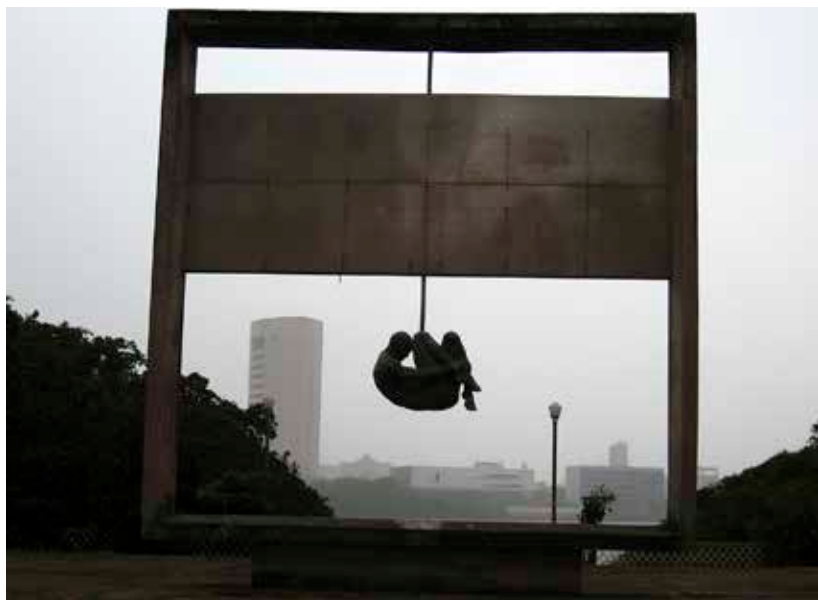
Imagem 2: Monumento Tortura Nunca Mais (Recife)