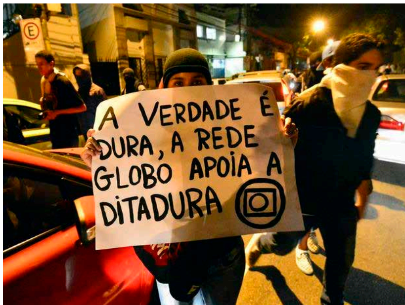
Imagem 6: Manifestação (RJ, 2013)

Fonte: < http://www.viomundo.com.br/wp-content/uploads/2015/04/globo_ditadura.jpg >. Acesso em: 22 mar. 2014.