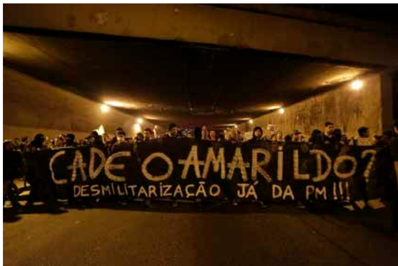
Imagem 7: Manifestação (RJ, 2013)