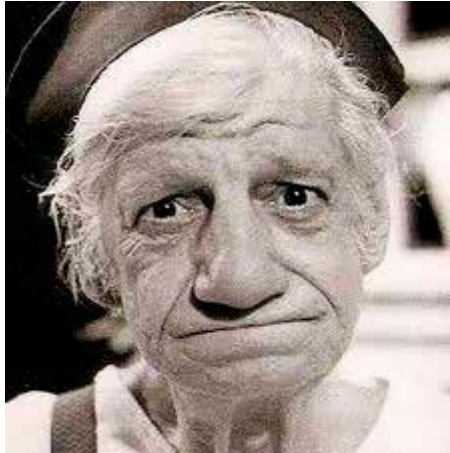
Imagem 4: Comediante Lírio Mário da Costa, o “Costinha”