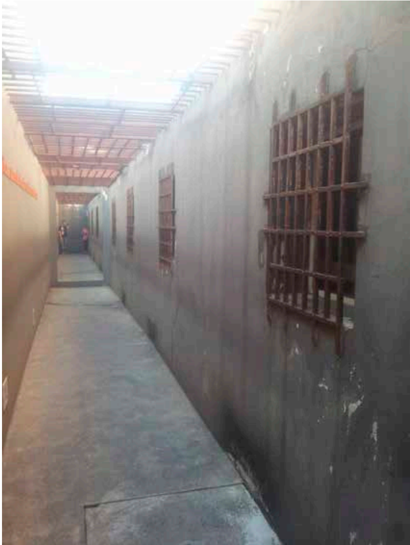
Imagem 1: Memorial da Resistência (SP)