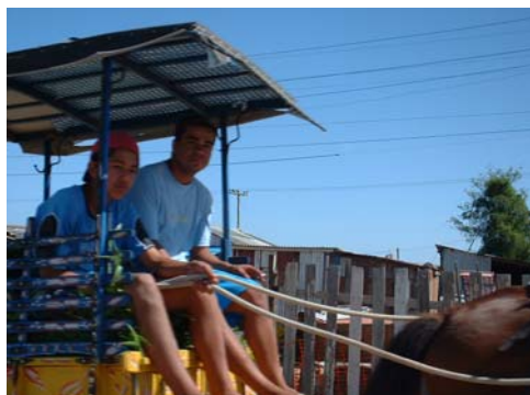
Figura 4 - Principal meio de transporte utilizado pelos catadores

Como etapa final, Strauss e Corbin (1998) recomendam uma síntese, chamada de selective coding , etapa na qual se busca o core , ou seja, a categoria central do estudo. Trata-se de encontrar, entre as categorias estudadas, aquela que é central ao fenômeno em estudo e relacioná-la com as demais, construindo um sistema de integração e relação semelhante à etapa anterior. É o nível mais abstrato da análise. A obtenção desta categoria central permite a construção de uma linha mestra no estudo do fenômeno, explicitando, entre todas as categorias, a mais significativa ao objetivo final.