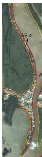
Figura 1 - Localização da Ilha Grande dos Marinheiros dentro dos limites do Parque, salientada no detalhe