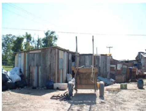
Figura 3 - Habitação típica da Ilha dos Marinheiros, construída com resíduos