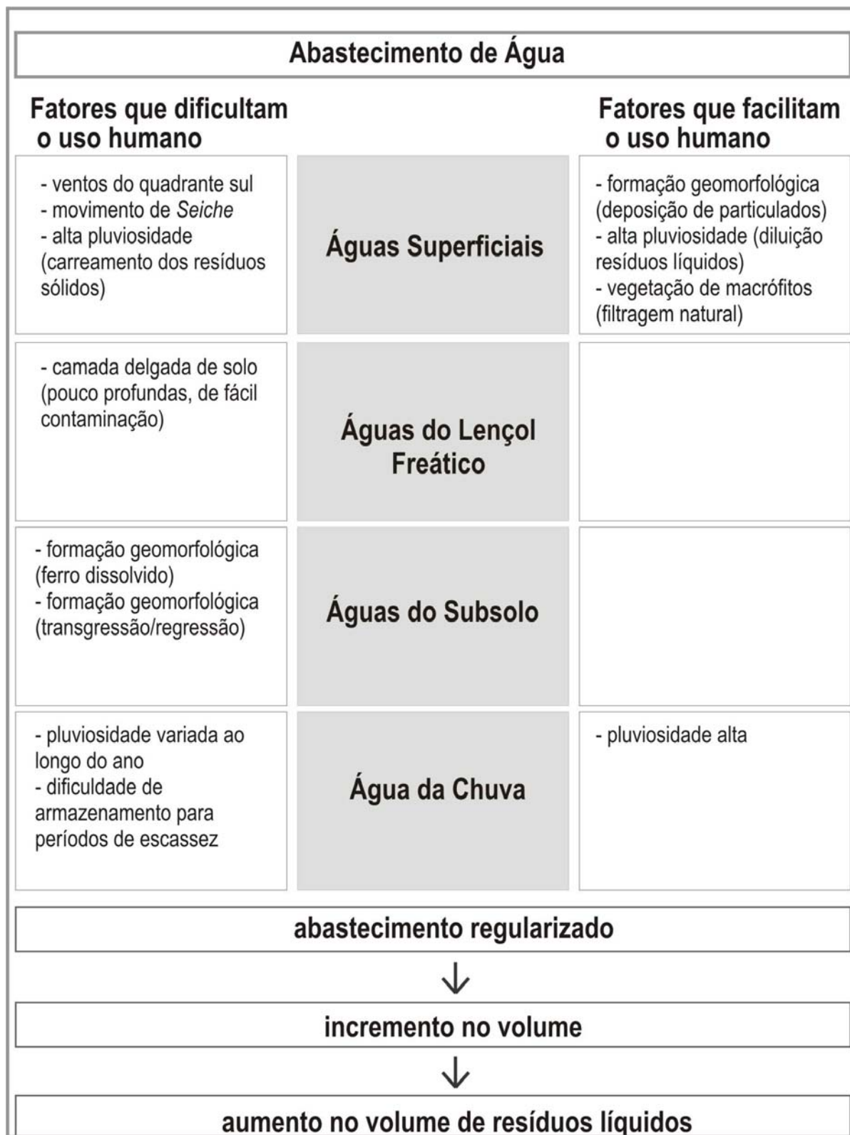
Figura 10 - Definição da linha mestra em torno da categoria central - abastecimento de água