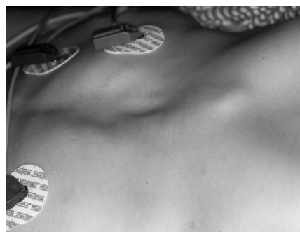
Figura 2. pectus escavatum.