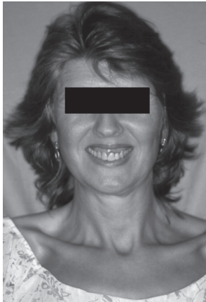
Figura 3. Aspecto frontal facial. Observar a face longa e estreita, com excesso vertical maxilar.

supranumerários mandibulares e a ocorrência de implantação anormal dos mesmos. De Coster et al. (2002), em um estudo de caso-controle, observaram ser a experiência de cáries, a presença de anomalias dentinárias (anomalias da cavidade pulpar, nódulos pulpares e alterações morfológicas radiculares) e esmalte hipoplásico, bem como a incidência de doenças do periodonto, maior nos pacientes afetados pela SM, na amostra estudada. Sugeriram uma correlação com a alteração do colágeno, sem descartar possíveis alterações hereditárias da dentina nas famílias estudadas, bem como a influência socioeconômica na prevalência de doenças bucais, já que as demais complicações da síndrome podem conduzir ao desinteresse pela saúde bucal. A manutenção desta, no entanto, é reconhecida como fator de sobrevida nestes pacientes, dado seu alto risco de endocardite bacteriana.