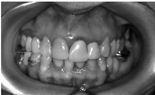
Figura 5. Aspecto da má oclusão, com tendência para estreitamento dos arcos dentários e excesso vertical maxilar.