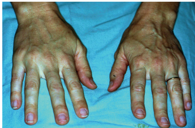
Figura 1. Aracnodactilia.

dificulta sua avaliação, especialmente com finalidades meramente científicas, considerando o alto custo dos exames de imagem, bem como a exposição a radiações ionizantes (TC). Fica assim prejudicado o maior entendimento desta condição.