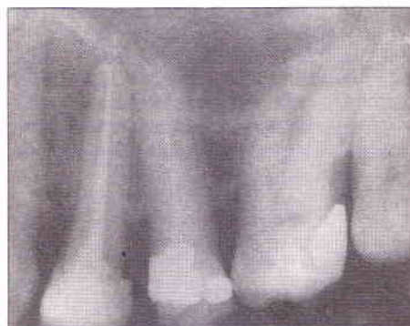
Fig. 5 - Proervação, evidenciando reparação apical. Observe a diminuição do espaço entre raízes do 23 e 24.