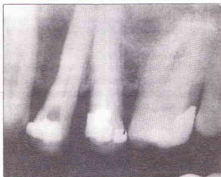
Fig. 3 - \text{Ca}(\text{OH})_2 como medicação de demora