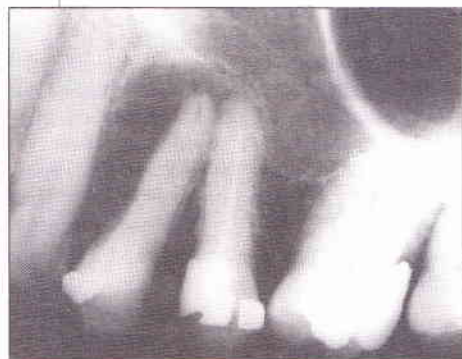
Fig. 1 - Radiografia prévia evidenciando abscesso crônico no 24. Observe espaço radiolúcido entre a raiz do 23 e 24