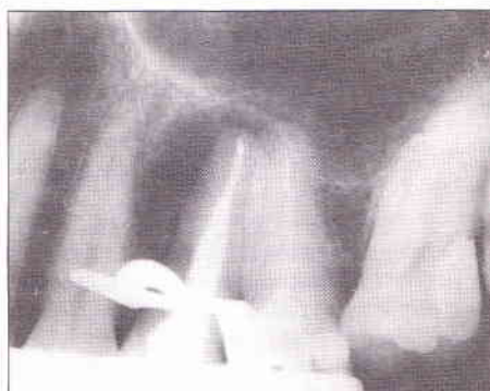
Fig. 4 - Radiografia final, após obturação do canal radicular