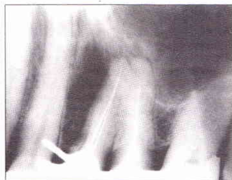
Fig. 2 - Odontometria dente 24