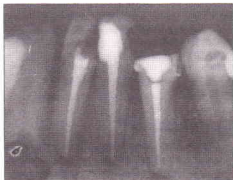
Fig 8 Prosaervação, com reparação dentes 32 e 33. Já com tratamento endodôntico no 31

como medicação de demora no caso de canais infectados com lesão apical.