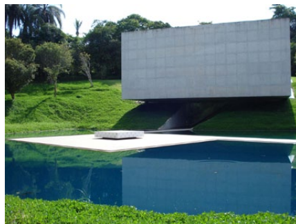
Fig. 4 - Adriana Varejão: Celacanto Provoca Maremoto , 2004 - 2008, óleo e gesso sobre tela.