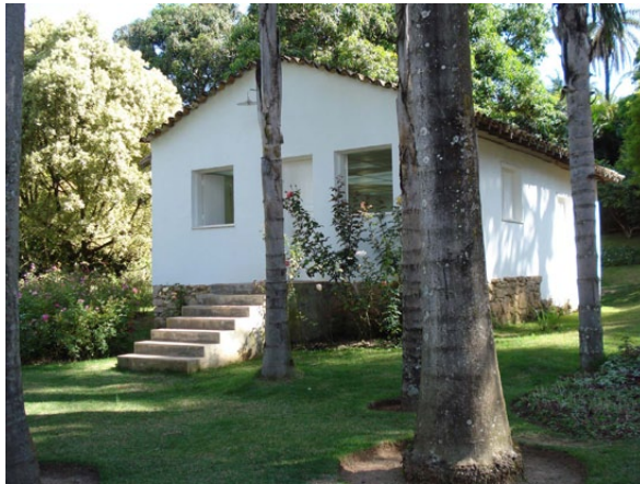
Fig. 6. Casa que abriga a obra Continente/Nuvem , de Rivane Neuenschwander. Foto da autora, em Inhotim.

nuvens e mapas, sempre em lento deslocamento... A obra de Rivane também usa a grade geométrica vista em todos os trabalhos de Varejão e, como esta, a artista também propõe uma fissura, que se faz nos deslizamentos que percorrem incólumes a rigidez das coordenadas angulares que estriam o desenho da lógica racional.