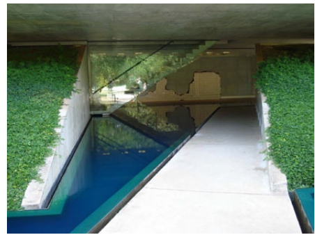
Fig. 1 - Vista do espelho d'água com Panacea Phantastica ao fundo. em Inhotim.