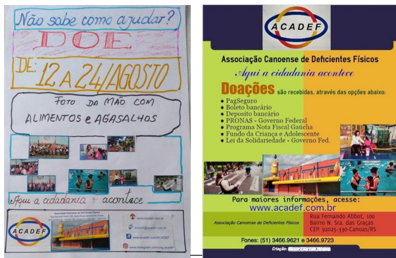
Figura 1 – Esboço e versão final de infográfico construído por idoso sobre uma instituição