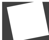
Imagem / Palavra / Imagem Image / Word / Image