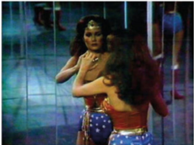
Figura 2. Dara Birnbaum, Technology/Transformation: Wonder Woman , 1978-79. Vídeo, cor, som, 5 minutos 50 segundos.

Então, na verdade, apropriação significava roubo, e era uma maneira de reconhecer que a propriedade é roubo e que aqueles que não têm acesso devem se apropriar dos meios de produção e dos materiais da cultura como um ato crítico. Houve muita discussão naquela época sobre os aspectos econômicos, sobre o roubo do rock and roll pela cultura branca, por exemplo, negação de direitos de publicação, injustiças econômicas que tornavam certos autores inviáveis. E ainda há pessoas sendo roubadas monetariamente, pessoas de culturas que não têm acesso a meios de produção.