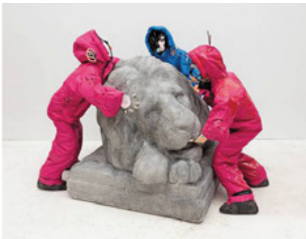
Figura 5. Ajay Kurian, Here to Help , 2016. Sacos de dormir que se vestem, fio de alumínio, fita adesiva, argila epóxi, cereais impressos 3-D, corrente de plástico, folhas falsas, areia, espuma, concreto, Rockite, tinta, ferragens, varas de incenso, poliuretano, 40 × 66 × 52".

Eu tenho muito medo disso. Eu já vi isso. Eu vi isso nos movimentos de que participei, no movimento ativista da AIDS e em outros movimentos de esquerda. Eu abandonei a política sectária para participar do ativismo da AIDS, porque a AIDS nunca foi um movimento político de uma questão única – a epidemia tocou em todas as questões e o ativismo da AIDS não era sectário, ao contrário da esquerda tradicional do final dos anos 70 e início dos anos 80, que era assolada por lutas internas terríveis. E agora eu sinto isso novamente no tipo de política que está surgindo, e me assusta.