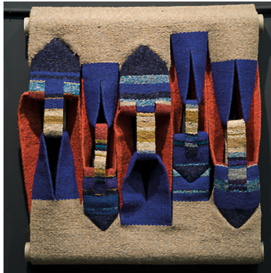
Figura 1: DOUCHEZ, Jacques (Macon, França, 1921 - São Paulo, SP, 2012) Funambulesca , 1980. Lã, sisal e algodão em tear de baixo liço, 134 x 131 cm. Aquisição por doação do artista, 1982.

se orgânica peça, não parecia pertencer a nenhuma tradição. Isso é uma tapeçaria? Uma escultura? Um objeto têxtil?" 10 (COTTON; JUNE, 2017, p. 57, tradução nossa). No mesmo ano, Jagoda Buic 11 expôs Colombe blessée , uma composição escultural, construída com lã e sisal (COTTON; JUNET, 2017). Sua monumentalidade criava uma relação com o espaço expositivo, desenvolvendo uma nova dimensão para a arte têxtil: "O muro deixava de ser o único suporte: a tapeçaria ganhava definitivamente o espaço, podendo ser dependurada no teto com uma grande exploração de formas, vazados e texturas três valores que passaram a dar-lhe nova feição" (CÁURIO, 1985, p. 104).