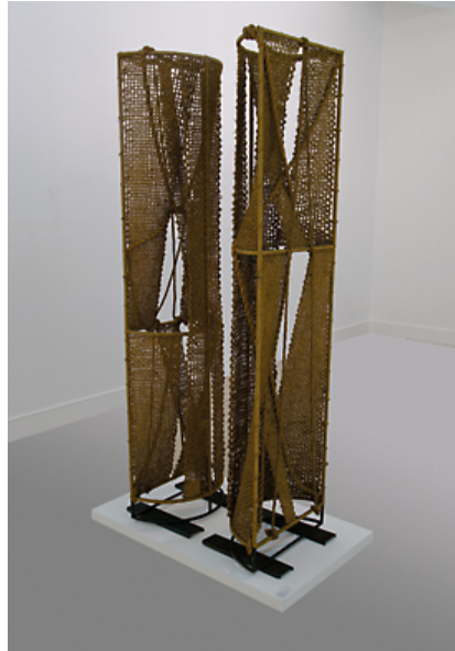
Figura 2: BETTIOL, Zoravia (Porto Alegre, RS, 1935) Série Metamorfose: Rapsódia , 1977. Tapeçaria manual com sisal, madeira e estrutura de ferro, 237 x 60 x 30 cm. Aquisição por doação da artista, 1979.

Zoravia tem duas obras, de séries diferentes, no acervo do Margs. A primeira, doada em 1979, é Rapsódia (Série Metamorfose) (figura 4). É uma peça inusitada no seu modo de construção, pois o suporte em ferro, que faz parte do trabalho final, substituiu o tear. Também o trabalho tem a característica de não se ater a uma maneira definitiva de exibição, podendo haver uma interação maior entre o visitante e o espaço expositivo.