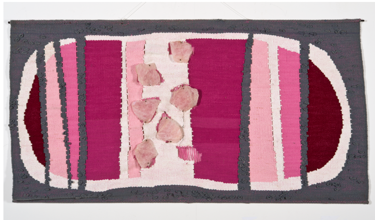
Figura 3: BETTIOL, Zoravia (Porto Alegre, RS, 1935) Transfigurações da pedra I: tapeçaria n° 58 , 1983. Tecelagem manual com algodão e pedra 71 x 134 cm. Aquisição por doação da artista, 1984. Fotografia: Fabio del Re e Carlos Stein – Vivafoto Fonte: Acervo do Museu de Arte do Rio Grande do Sul – Margs.

Posteriormente, Zoravia doou uma tapeçaria bidimensional, representante da série Transfigurações de pedra (figura 5). Nessa série, a artista, durante a tecelagem, incluiu objetos naturais, como pedras e conchas, inspiradas nas próprias formas da natureza na sua construção. Ambas as obras, são de execução posterior à viagem de