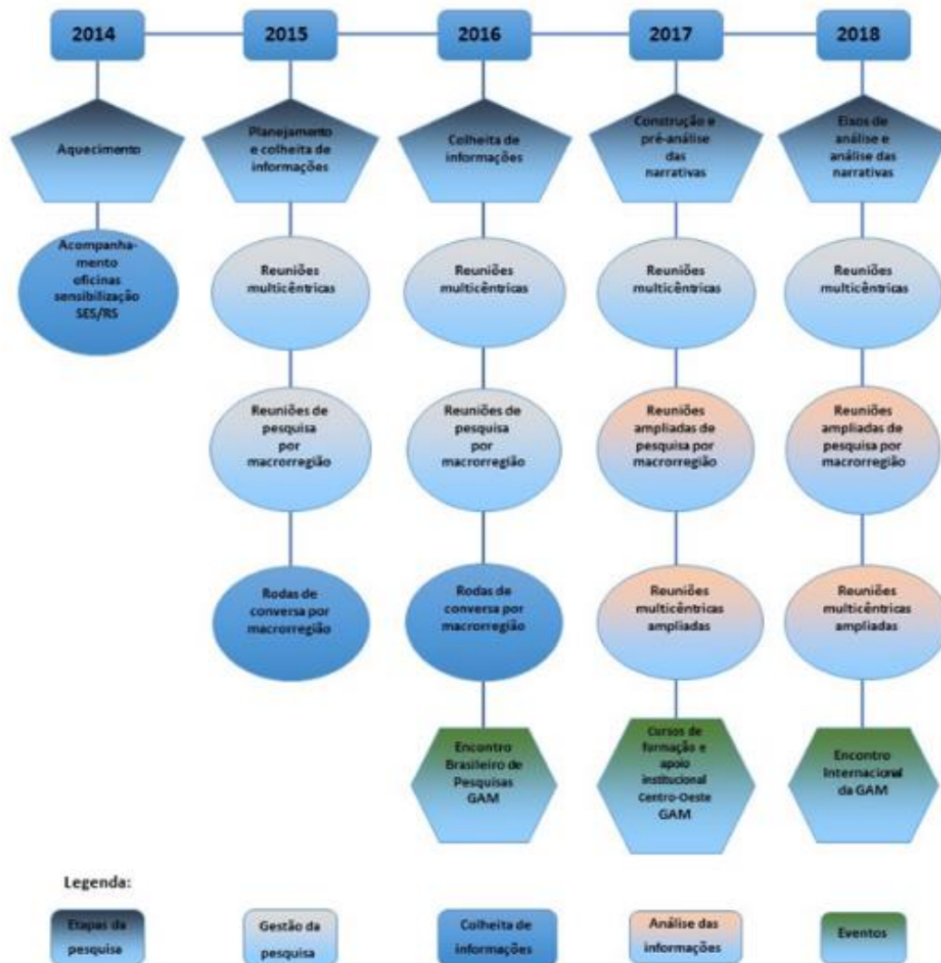
Figura 1. Dispositivos da pesquisa.