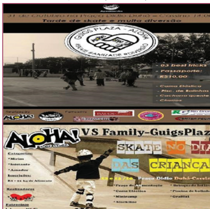
Figura 2 - Da relação com as crianças

A enunciação “doe um pouco de alegria a quem precisa”, referindo-se aos idosos pobres asilados, por mais sutil e singela, coloca em operação um desvio com relação à normalidade jovem 15 . Logo, desprovidos dos atributos sociais da juventude, sobretudo, de uma “alegria” supostamente intrínseca ao jovem, os velinhos são posicionados como sujeitos anormais, como um outro o qual é preciso incluir, carente de assistência e cuidado. Aqui, o skatista funciona como figura de sujeito emblemática na articulação entre doação de normalidade jovem aos velinhos e operação de uma norma entre o próprio público de idosos, já que não se trata de qualquer velinho, mas daqueles “bons”, não por acaso, residentes do Asilo de Pobres da cidade.