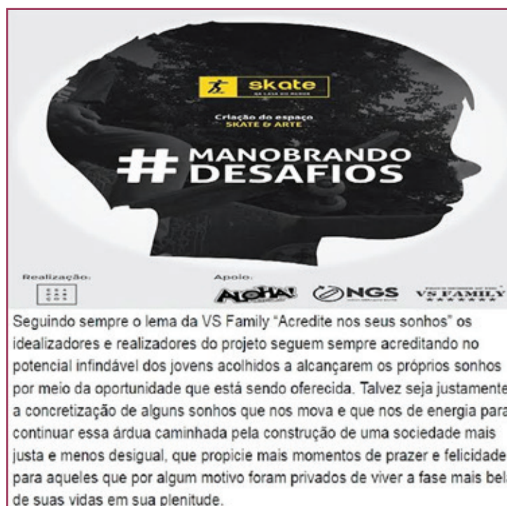
Figura 4 - Relação com os jovens abrigados em casa de acolhimento

Nesse contexto, o evento pode se estabelecer com legitimidade pela comunidade, alcançando, entre outras coisas, uma série de patrocinadores não envolvidos diretamente com a prática e uma visibilidade aos skatistas organizadores, que foram rotulados de “heróis da juventude da periferia”. Assim, foi possível que, na sua terceira edição, divulgada no cartaz acima, a competição de skate, especificamente a final da segunda etapa do circuito amador de street skate gaúcho de 2015, pudesse incorporar-se ao evento como nada mais que um atrativo, entre as diferentes práticas inclusivas que ali se fizeram presentes numa composição articulada “pela cidadania”, como tendas de saúde, panfletagem de políticas de prevenção de drogas, aferimento de pressão arterial, corte de cabelo gratuito, tendas de doação e de acolhimento de animais de rua, distribuição de preservativos, entre outras. Aqui, a cidadania pode funcionar como norma legitimadora, criando condições para que um evento pequeno da periferia pudesse alcançar as parcerias e patrocínios de diferentes outros grupos sociais, tangenciados na produção do skatista cidadão.