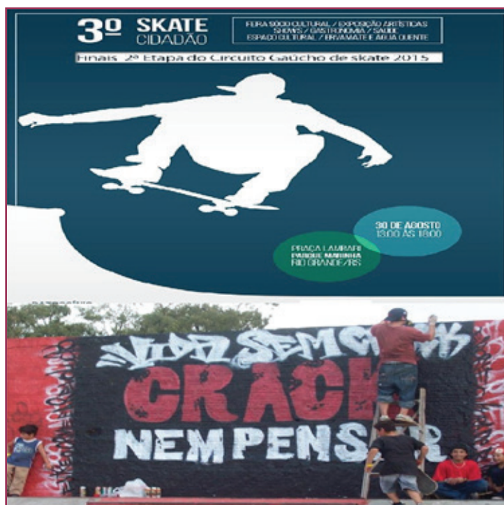
Figura 3 - Da relação com a cidadania

Há, nesses cartazes, a incitação e produção de uma parcela infantil de skatistas a qual se quer incluir, em virtude do exercício de poder de determinados discursos sobre a infância inaugurados na Modernidade, visando “proteger as crianças das vicissitudes do mundo adulto e, ao mesmo tempo, vigiá-las e cuidá-las” (BUJES, 2010, p.168). Logo, manter as crianças skatistas sob vigilância permite, entre outras coisas, garantir uma previsibilidade do skatista adulto do futuro, sem menções a práticas de transgressão urbanas e elementos estéticos articulados ao punk e, especialmente, sem vinculá-las ao universo esportivo competitivo do skate, uma vez que é próprio da infância – enquanto verdade instituída – afastar-se do mundo adulto e sintonizar-se com seus códigos próprios, como a “diversão”, “a amizade” e o mundo colorido de balões e infláveis que o skate também pode oportunizar.