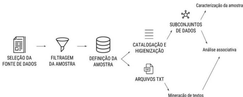
Figura 1 - Percurso metodológico do estudo.