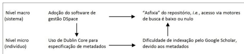
Figura 3 – Diagrama de Boudon-Coleman para o mecanismo “Asfixia do RI por indexação dificultada por metadados”.

Bunge (1997) recomenda representar mecanismos com o uso de diagramas de Boudon-Coleman, como o da Figura 3. Esses diagramas relacionam eventos no nível do sistema com suas causas e efeitos no nível do indivíduo componente do sistema. Também é possível conjecturar explicações relacionando eventos nos níveis do sistema e seu supersistema. Cada seta representa um elo causal que pode ser verificado em uma ou mais pesquisas experimentais.