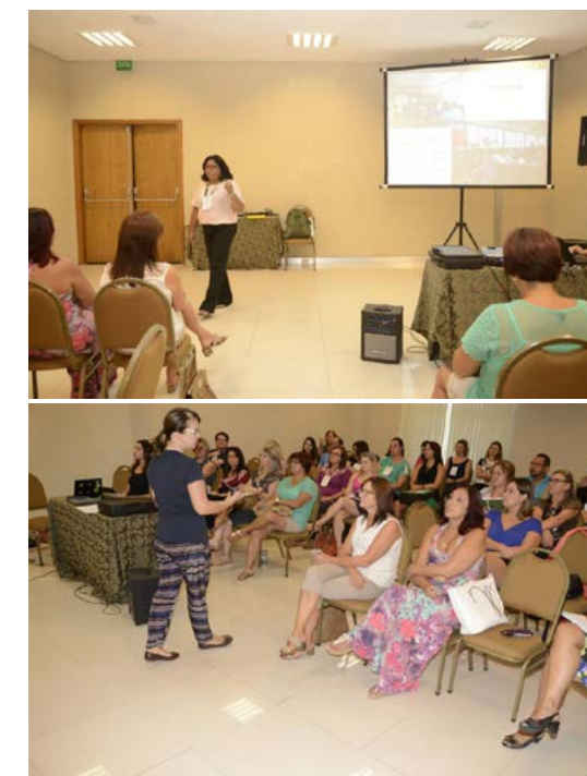
Figura 6 – Professoras da UFPEL apresentando metodologias alternativas no III Seminário Regional do PNEM