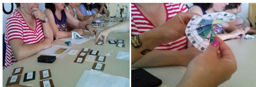
Figura 3 – Atividade de dobradura e jogos didáticos realizados durante o primeiro encontro da área de Ciências da Natureza com os formadores regionais