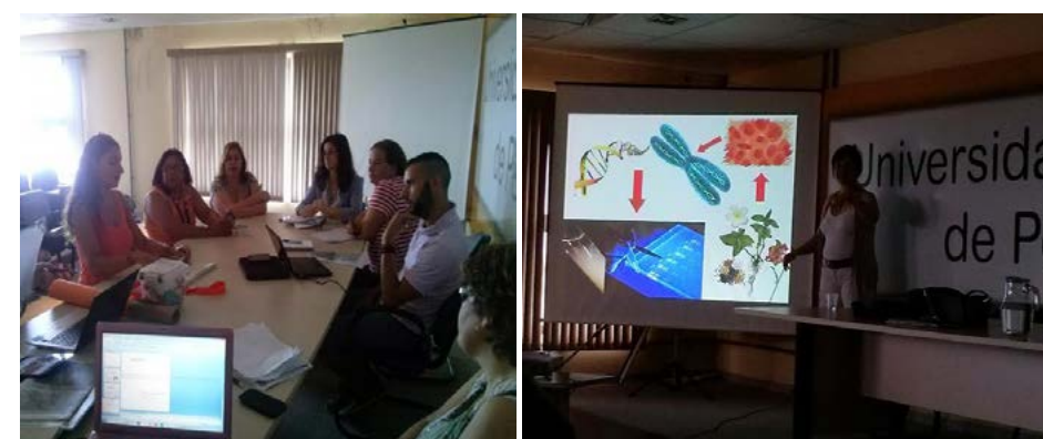
Figura 4 – Discussão com formadores regionais sobre a pertinência das atividades e uso da tecnologia para tornar significativo o conhecimento