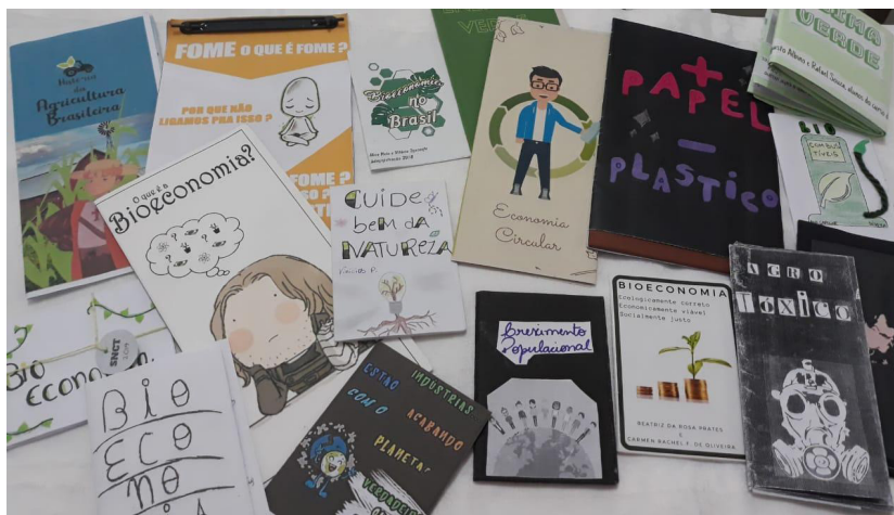
Figura 2: Capas de Fanzines produzidos no projeto

Como já ressaltado, o tema estabelecido para leitura, análise, pesquisa e confecção dos fanzines esteve ligado à temática da SNCT de 2019: Bioeconomia: diversidade e riqueza para o desenvolvimento sustentável . A partir da temática, os alunos puderam desmembrar subtemas ligados à bioeconomia para concretizar a confecção. As subtemáticas foram bem diversificadas, no entanto, as que mais se destacaram foram: sustentabilidade ambiental, fome, segurança alimentar, conceituação de bioeconomia, energia verde, lixo, biocombustíveis, agrotóxicos, entre outros. Na Figura 2, apresenta-se uma parte do conjunto das produções realizadas no decorrer do projeto: