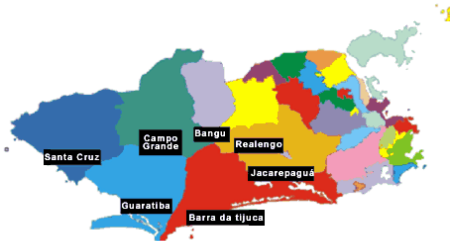
Figura 1: Mapa da Cidade do Rio de Janeiro destacando a denominada Zona Oeste.

As áreas de planejamento foram, inicialmente, conceituadas no Plano Urbanístico Básico da Cidade do Rio de Janeiro de 1976. Cada Área de Planejamento engloba algumas Regiões Administrativas, que, por sua vez, comportam alguns bairros. A zona Oeste da cidade do Rio de Janeiro compreende duas Áreas de Planejamento: a AP-4 e a AP-5. A AP-4 é composta pela Região Administrativa XVI- Jacarepaguá 7 e Região Administrativa XXIV- Barra da Tijuca 8 ; já a AP-5 pelas Regiões Administrativas XVII- Bangu 9 , XVIII- Campo Grande 10 , XIX- Santa Cruz 11 , XXVI- Guaratiba 12 e XXXIII- Realengo 13 .