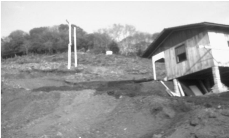
Figura 3: Moradia construída em área com alta declividade sem tomar as medidas passíveis na lei.

Assim, este processo de valorização acontece em todas as cidades, independente de suas dimensões, e na área investigada não é diferente. Sendo assim, as pessoas com baixo poder aquisitivo estão se instalando nas áreas mais elevadas e distantes do centro, chegando a burlar a lei que estipula que a declividade máxima de uma área para que possa haver construções é de 45°. Como se pode evidenciar na Figura 3, há uma construção em um terreno com declividade acima do permitido, e que, para efeitos de lei, deveriam ser tomadas providências para se evitar maiores impactos ambientais, como, por exemplo, a construção de um muro para evitar a erosão do solo removido. O que se observa é exatamente a falta dessas medidas, como se pôde verificar in loco durante a investigação. Considerando todas essas informações\dados levantados no desenvolvimento desta investigação, conclui-se que é de fundamental importância a existência de Planos Diretores e, principalmente, o seu cumprimento, pois eles determinam as leis para melhor ocupação das áreas urbanas, bem como a proteção das áreas de Preservação Ambiental. Somente com o cumprimento das leis é que se poderão amenizar os impactos da urbanização no meio ambiente.