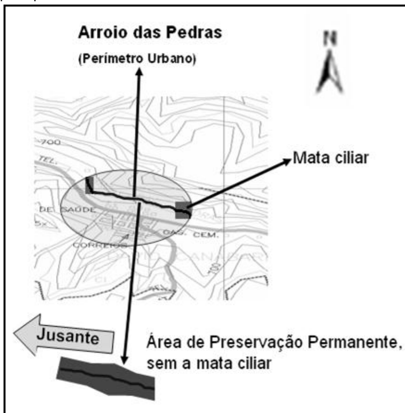
Figura 2: Panorama geral do relevo, recursos hídricos da região e alguns pontos do espaço urbano de David Canabarro.

Pode-se perceber, na Figura 2, que o Arroio das Pedras está com quase toda a sua mata ciliar degradada no perímetro urbano, bem como alguns pontos, como o posto de combustível e o cemitério, e as curvas de nível, que representam a declividade do terreno.