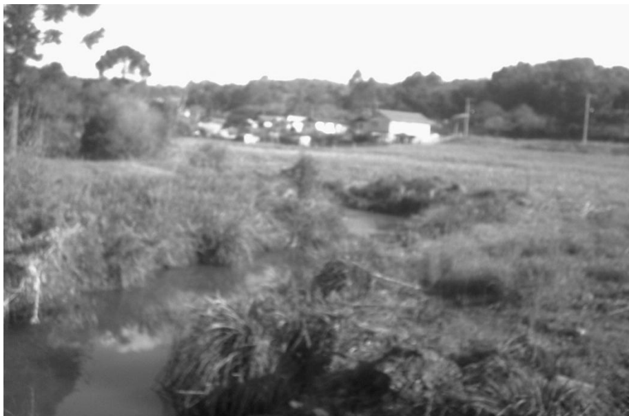
Figura 4: Área agrícola próxima à cidade.

primitiva era constituída de matas de terra firme, a ocupação por plantações agrícolas a partir da década de 50, século XX, substituiu a vegetação primária por matas secundárias e capoeiras, pastagens e macega. Este processo acarretou o aumento da lixiviação, contribuindo com um maior aporte de material detrítico transportado pelas vertentes através da ação do escoamento superficial até o leito do arroio. No entanto, nestas mesmas áreas, o rio transborda com as chuvas, inundando grande parte das plantações.