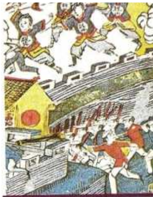
Cartaz de propaganda dos boxers m uma base estrangeira.

No subtítulo dedicado à dominação na China, a imagem (Figura 4) escolhida para o tema foi um cartaz produzido pelos Boxers, referente à Guerra dos Boxers, um grupo de radicais chineses que lutavam pela libertação do país.