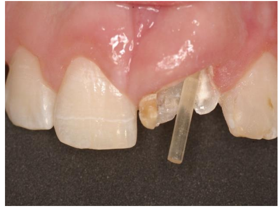
Figura 8 - Prova do pino de fibra de vidro prévio à cimentação e inclinação acentuada do pino