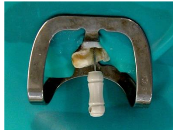
Figura 4 – Localização dos canais para tratamento endodôntico.

coronorradicular (NOTHDURFT et al., 2008; SALAMEH et al., 2008; D'ARCANGELO et al., 2008). A terapia endodôntica foi realizada pela técnica coroa-ápice (figura 4) e obturação dos condutos radiculares pela técnica da condensação lateral. Observou-se a obturação dos dois canais radiculares paralelos (principal e colateral) e da perfuração com guta percha e cimento endodôntico (Endofill – Dentsply, York, PA, USA). Ocorreu sobre-obturação lateral mesial, devido à dificuldade de controlar a inserção dos cones de guta percha acessórios (figura 5). Todavia, optou-se pela proservação do caso, observando-se, em um primeiro momento, a resposta clínica do paciente (ausência de sintomatologia) e, posteriormente, o resultado radiográfico (desejável formação de tecido ósseo reparador) (conforme necessidade futura, seria realizado acesso cirúrgico para remoção dos excessos de material obturador endodôntico).