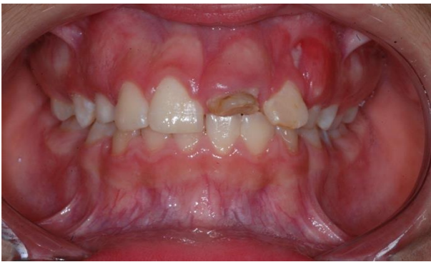
Figura 1 - Aspecto inicial, vista frontal, destacando a destruição coronária do dente 21 e restauração deficiente no dente 22.

Paciente do gênero masculino, com 12 anos de idade, chegou à clínica odontológica com sequelas de trauma nos elementos dentários 21 e 22, sendo que o dente 22 apresentava restauração prévia deficiente, enquanto o dente 21 mostrava amplo comprometimento coronário (fratura e selamento provisório) e necessidade de tratamento endodôntico (figuras 1 e 2).