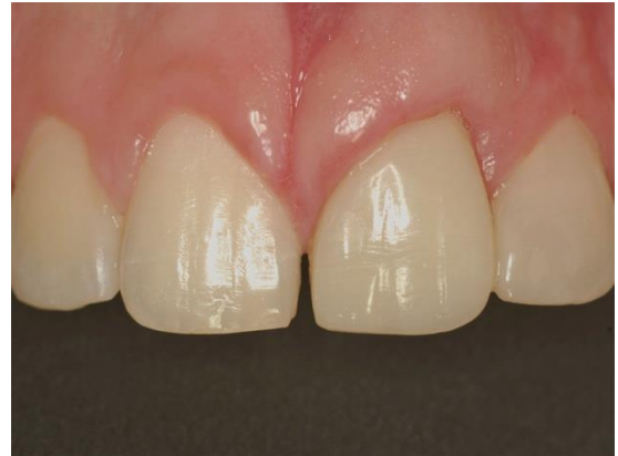
Figura 9 - Caso concluído, vista frontal final (reconstrução do 21 e substituição da restauração do 22 em resina composta) .