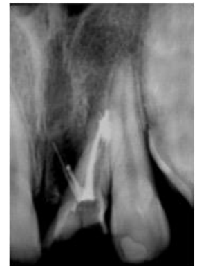
Figura 5 – Tratamento endodôntico concluído com desobturação parcial do canal principal e sobre-obturação lateral mesial.