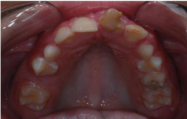
Figura 2 - Aspecto inicial, vista oclusal, destacando o posicionamento do dente 21.

A partir do exame radiográfico, verificou-se que o dente 21 apresentava 2 condutos radiculares (1 principal e 1 colateral), perfuração mesial e mal formação coronorradicular, além de área radiolúcida mesial compatível com lesão inflamatória lateral (figura 3). O paciente relatou histórico de traumatismo na dentição decídua - o que justifica as alterações anatômicas coronorradiculares - e novo trauma recente na dentição permanente seguido de necrose pulpar e fratura coronária extensa. O plano de tratamento elaborado visou a