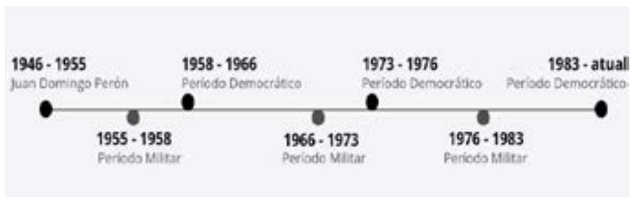
Figura 1 – Cronologia de transições (1946 – 2019)

autoritários em antigos governos peronistas. Com isso, para facilitar a compreensão, é importante traçar uma linha temporal (Figura 1).