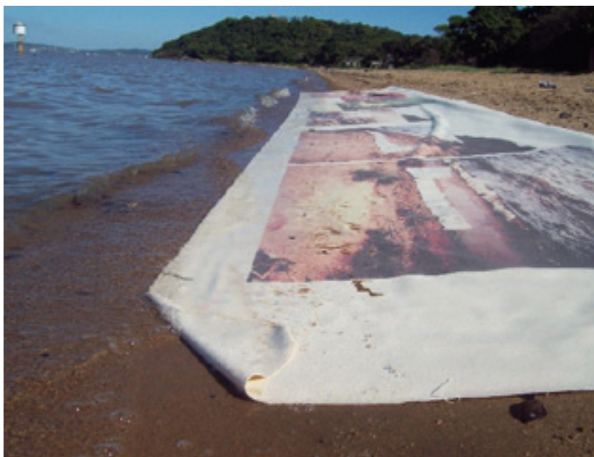
Figura 1. Clóvis Martins Costa. Processo de impregnação sobre a margem do Guaíba. Fotografia digital. Dimensões variadas. 2011.

Este conjunto de fotografias foi apresentado pela primeira vez impresso em papel fotográfico. Posteriormente, as imagens foram impressas sobre tecido, como um retorno ao corpo da pintura, resultado este que considere mais apropriado para a sua apresentação. Nestas imagens, a fotografia aparece invadida por elementos advindos do contato do tecido com a margem do rio, tais como água, galhos, areia, restos de papéis e outros despojos do rio. Imagens contaminadas que causam certo estranhamento ao serem observadas, pois não se identifica claramente que se trata da fotografia de uma fotografia e, ao mesmo tempo, as paisagens que se enunciam são cortadas por planos da própria divisão entre as áreas de impressão, bem como sofrem alterações devido ao tipo de corte fotográfico ao qual foram submetidas (figuras 2,3,4 e 5).