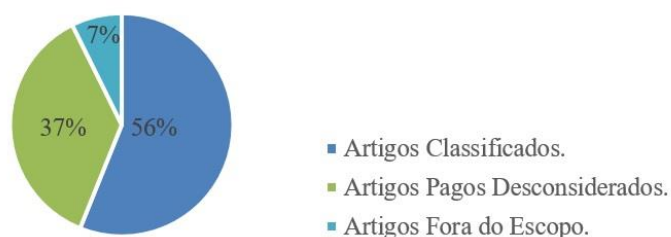
Figura 2 – Gráfico de porcentagem de artigos considerados ou não nesse estudo.

desconsiderados 37% (n = 15) dos artigos, em razão de serem pagos e 7% (n = 3) dos artigos, por estarem fora do escopo do estudo.