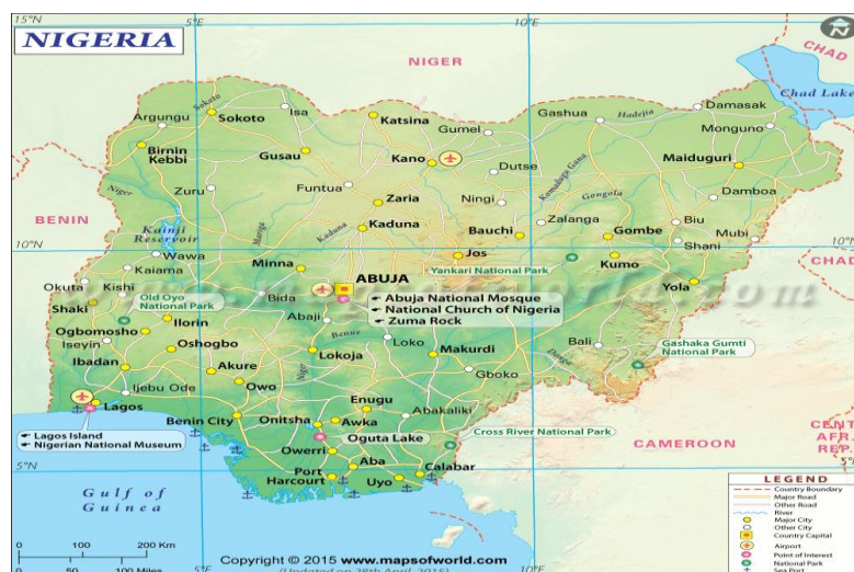
Figura 1 – Mapa da Nigéria

Entre os países limítrofes, a Nigéria se destaca expressivamente. Para entender sua potencialidade, compara-se aos vizinhos (Tabela 1), a oeste Benin, ao norte Níger, ao nordeste Chade e ao leste Camarões.