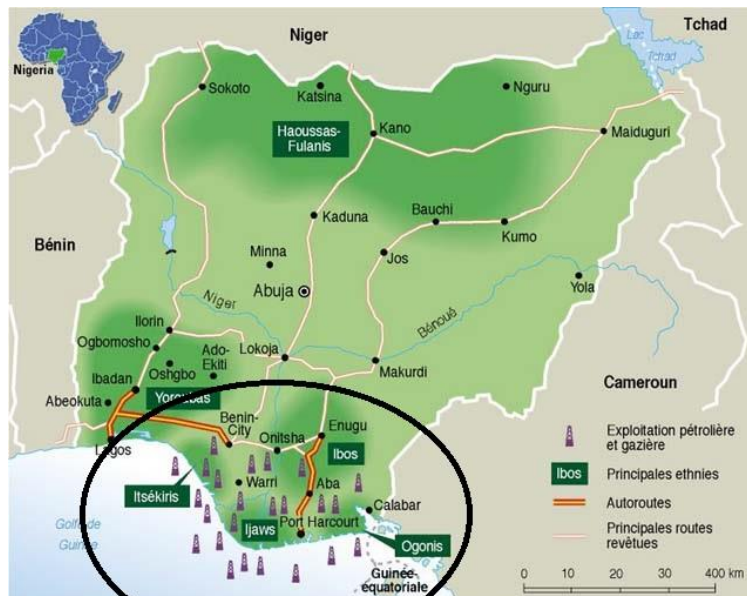
Figura 2 – Concentração de poços petrolíferos na Nigéria