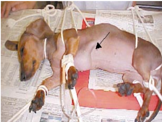
Figura 1. Cão com dificuldade respiratória, sendo evidenciado o esforço na inspiração (seta).