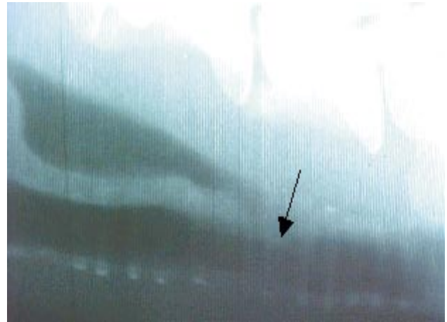
Figura 2. Estreitamento da luz traqueal (seta).