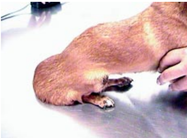
Figura 1. Animal apresentando hiperextensibilidade cutânea na região posterior.

Foi examinada uma cadela Pinscher de 3 anos de idade, portadora de hérnia perineal bilateral. Ao exame clínico foi notado hiperextensibilidade cutânea e o proprietário relatou que freqüentemente o animal apresentava ferimentos na pele. Durante a hernioplastia colheu-se um fragmento de pele que foi processado de acordo com o método convencional de histologia e corado com hematoxilina e eosina (HE) e Mallory.