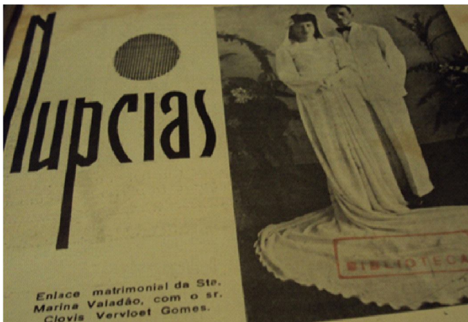
Figura 1. Anúncio de enlace matrimonial

És noiva...Em breve há de raiar o dia, Festivo, azul, vibrante de alegria, Que te sorri num céu de rosciclér, Irás à igreja. E num altar formoso, Branca de anseio, trêmula de gozo, Verás florir teu sonho de mulher (VIDA CAPICHABA, s/p, 1945).