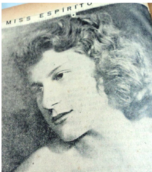
Figura 4. Fotografia do rosto da miss Espírito Santo de 1949

As dicas das novidades da medicina estética, desse modo, "[...] sugerem à leitora que é possível ter um corpo semelhante aos das modelos, ou que a beleza que as 'estrelas' possuem é fruto do correto investimento (possíveis para todas) em seus corpos" (ALBINO; VAZ, 2005, p. 215). De acordo com Lipovetsky (2000), neste período, o uso de cosmético é um imperativo de civilidade e a boa aparência se torna por vez dimensão essencial do feminino. A Vida Capichaba preenchia suas páginas com muitas imagens de rostos de mulheres jovens. Os gestos e costumes que buscaram uma fisionomia mais a moda revelam, também, as diversas nuances do sonho de ser moderno e civilizado (SANT'ANNA, 1995). Como mostra uma fotografia do rosto da miss Espírito Santo de 1949, a qual, de acordo com a revista, merece homenagem devido aos "seus dotes físicos, de espírito e pela sua elegância" (VIDA CAPICHABA, 1949).