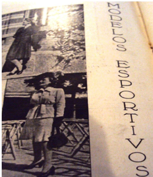
Figura 5. Hábitos cosmopolitas