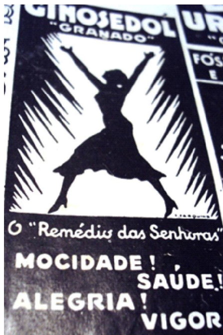
Figura 2. Anúncio de estimulantes e fortificantes

De acordo com Xavier (2008), o desenvolvimento dos estudos na área da ginecologia e obstetrícia reforçou os conceitos de que a mulher possuía uma saúde mais debilitada. Nessas circunstâncias, o uso de fortificantes e estimulantes era visto como auxiliares no fortalecimento do corpo das senhoras e contribuíam para manutenção de sua saúde, como ilustrado nas figuras abaixo: