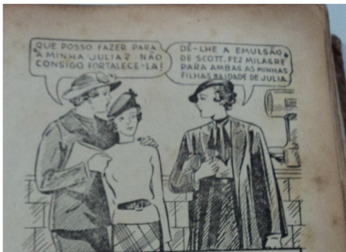
Figura 3. Anúncio de estimulantes e fortificantes